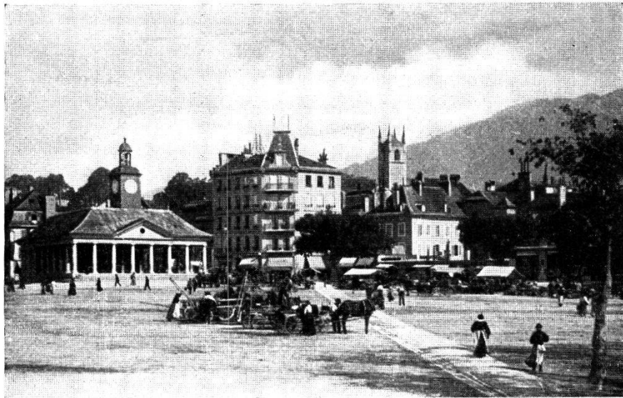
Vevey. — La Grenette et la place du Marché.

D'après A. de Montet, Vevey doit avoir eu très anciennement son marché dans la ville, sur la place à l'orient du bourg, qui prit le nom de Vieux mazel ou du Vieux marché. D'après une supplication des Veveysans au duc de Savoie, en 1470, il aurait