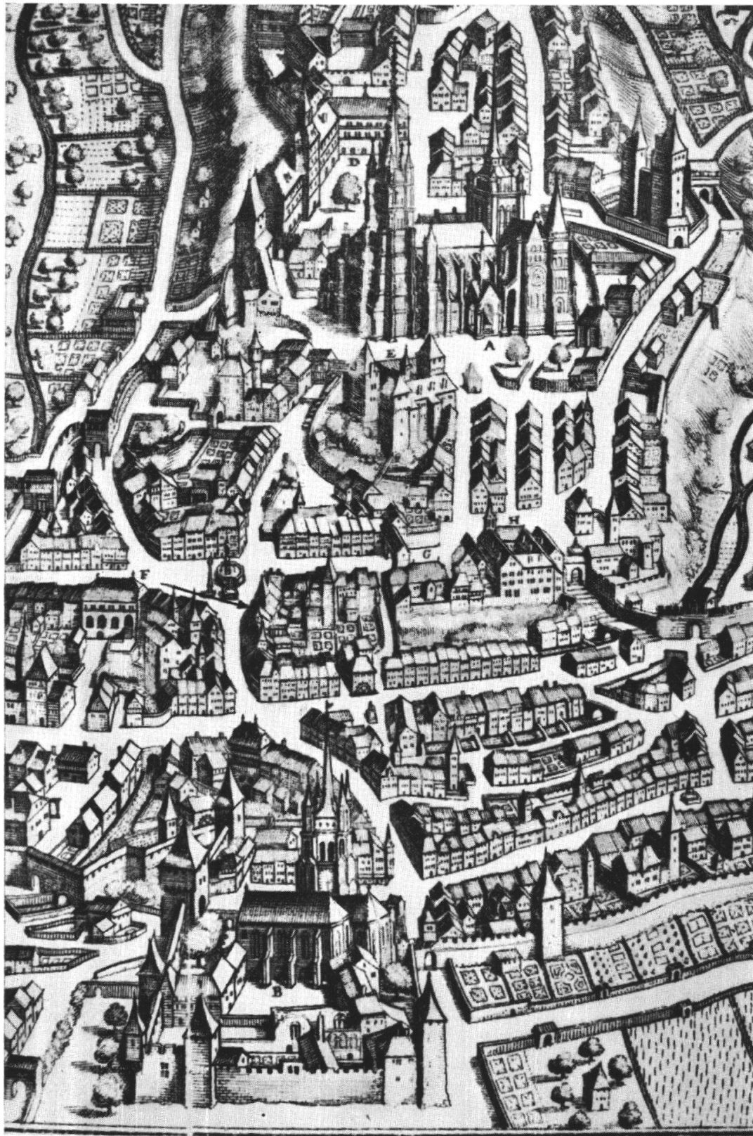
Fragment du plan Matthäus Merian ( Topographia Helvetiæ, Rhetiæ et Valesiæ , 1642.)