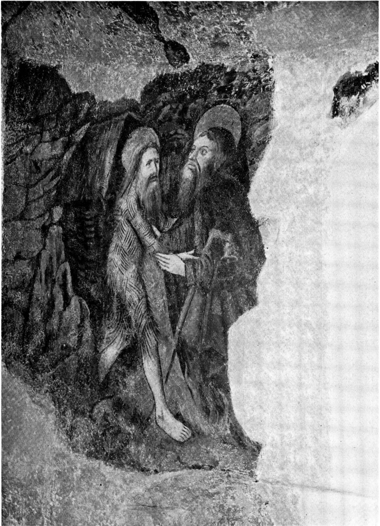
Saint Antoine et saint Paul l'ermite