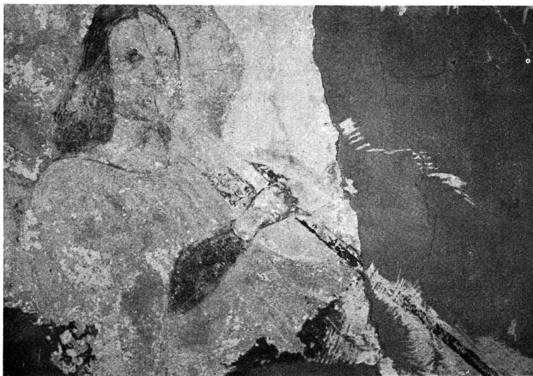
Eglise Saint-Etienne de Moudon : Ange musicien

En 1488 (?), dans chaque travée, chaque voûtain a été décoré d'un ange jouant d'une longue trompette, dont il reste des traces