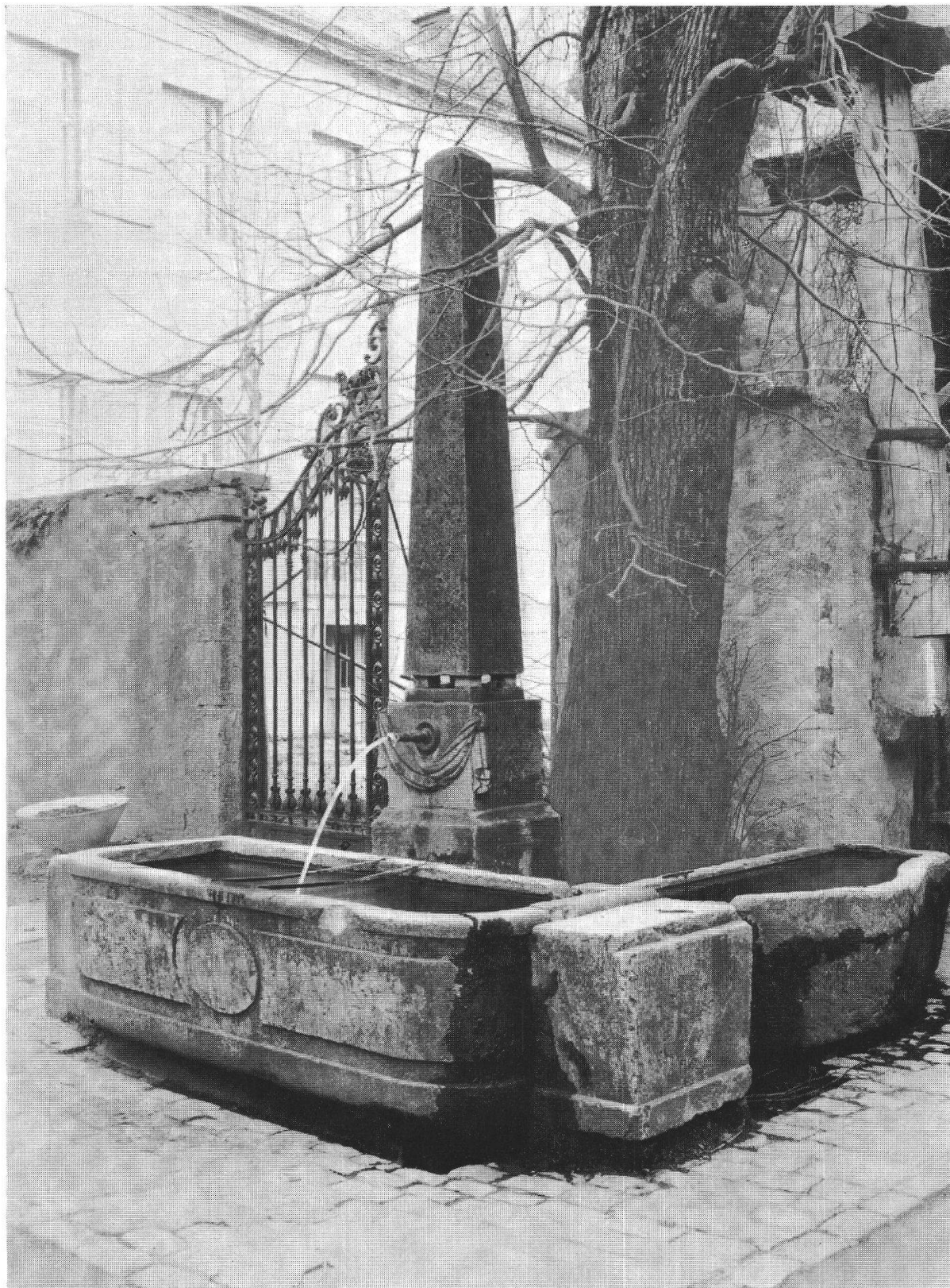
Fig. 5. — Fontaine de la cour rurale.