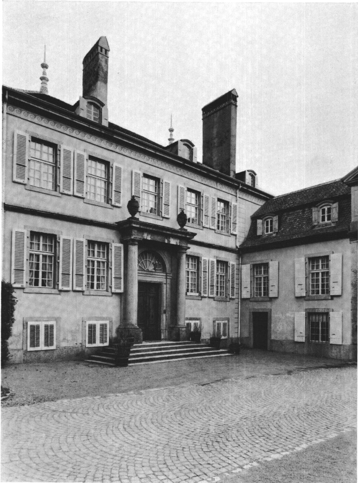
Fig. 2. — Angle sud de la cour d'honneur.