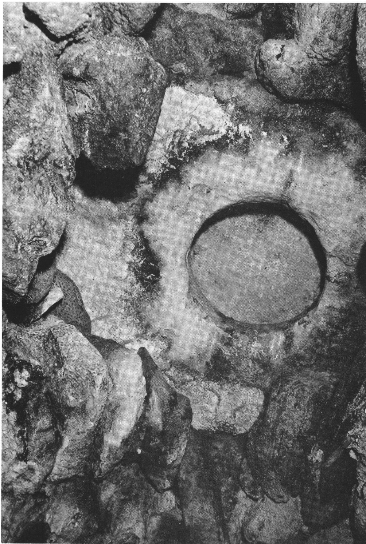
Fig. 3 – Trou d'homme dans la voûte du cloaque