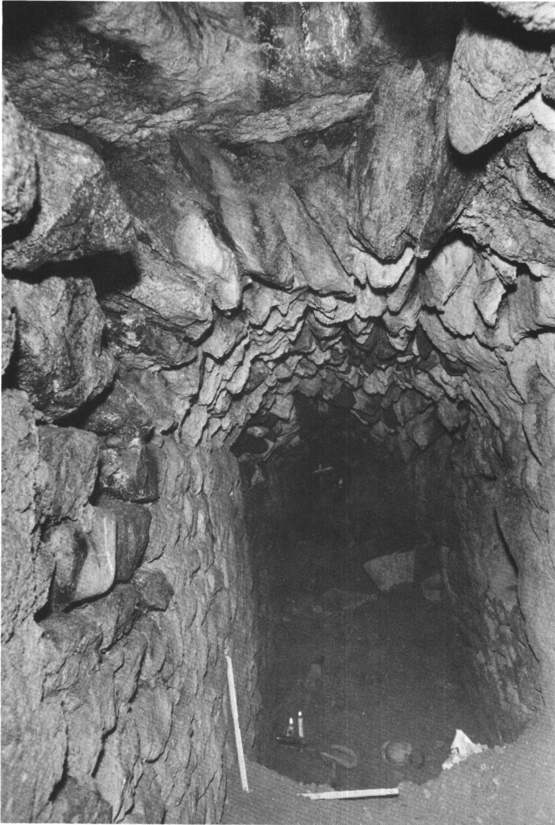
Fig. 2 — Cloaque de Nyon