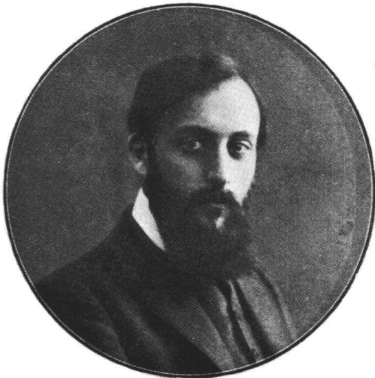
Ernest Ansermet en 1911