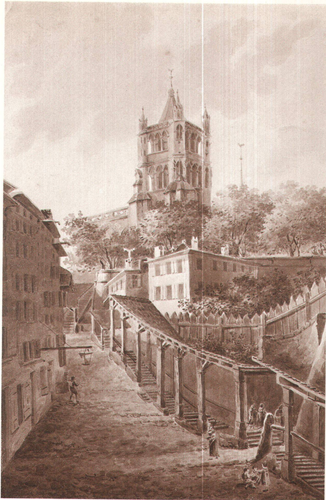
Le beffroi vu des Escaliers du marché, vers 1820 J.-J. Wetzel, MHAEL Coll. du Vieux-Lausanne, photo A. Held