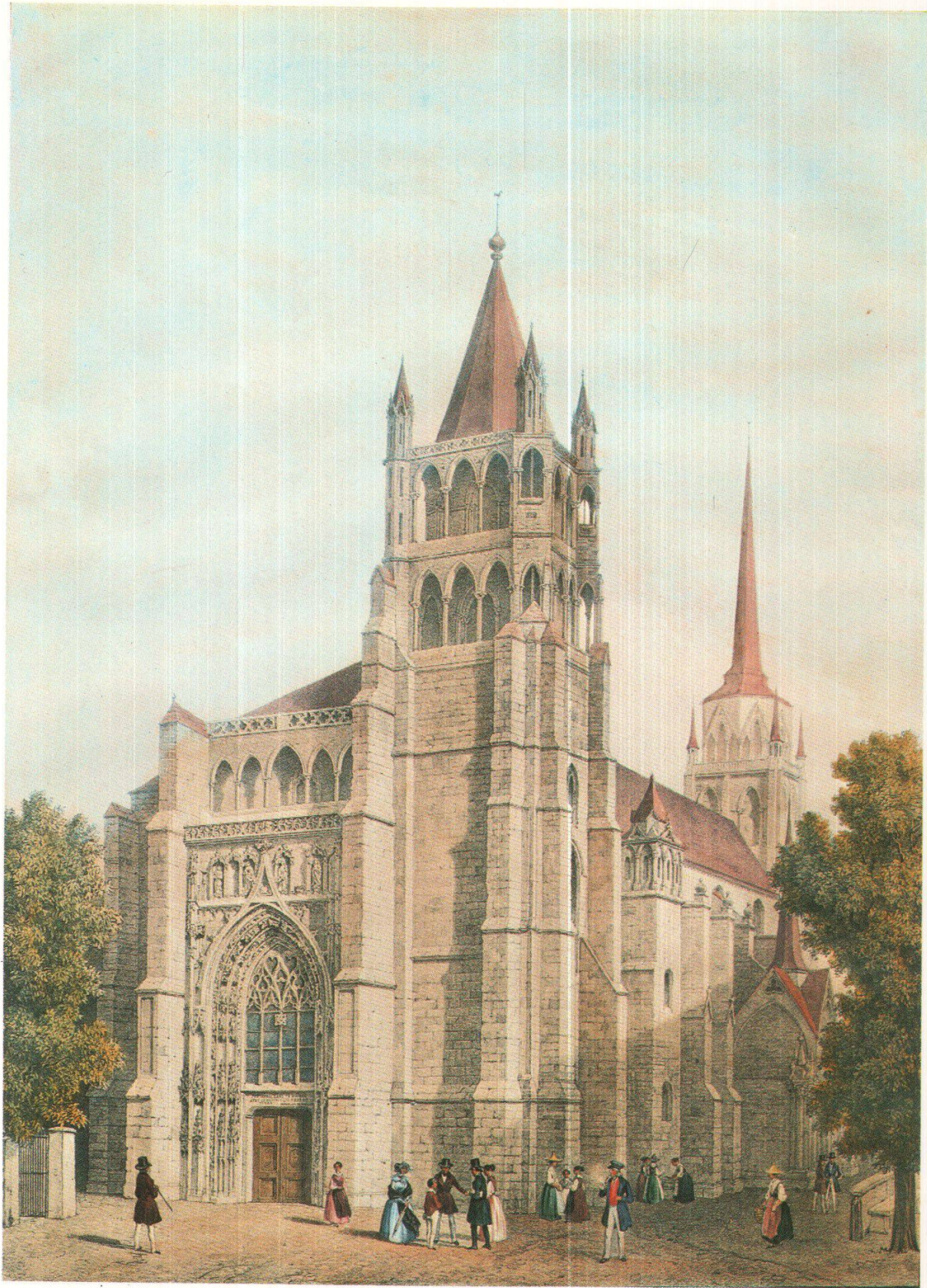
Notre-Dame de Lausanne, vers 1849 F. Martens, MHAEL Coll. du Vieux-Lausanne