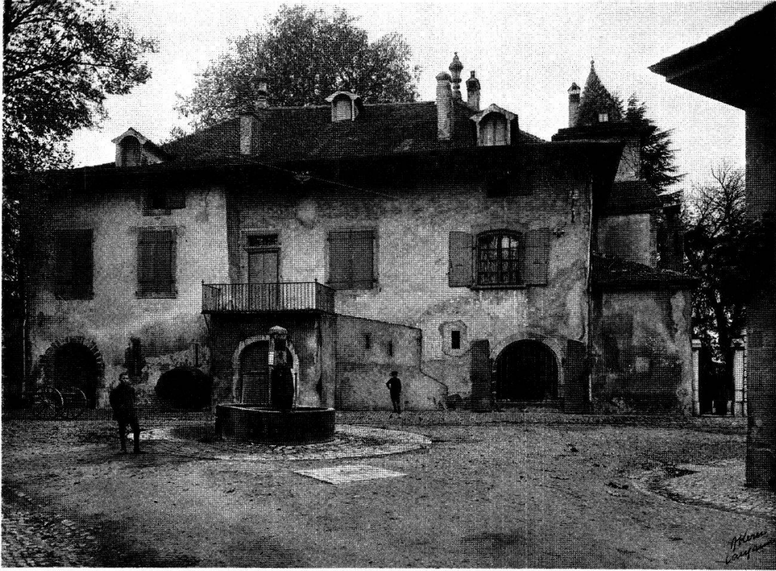
La maison du syndic Silvestre Forel.