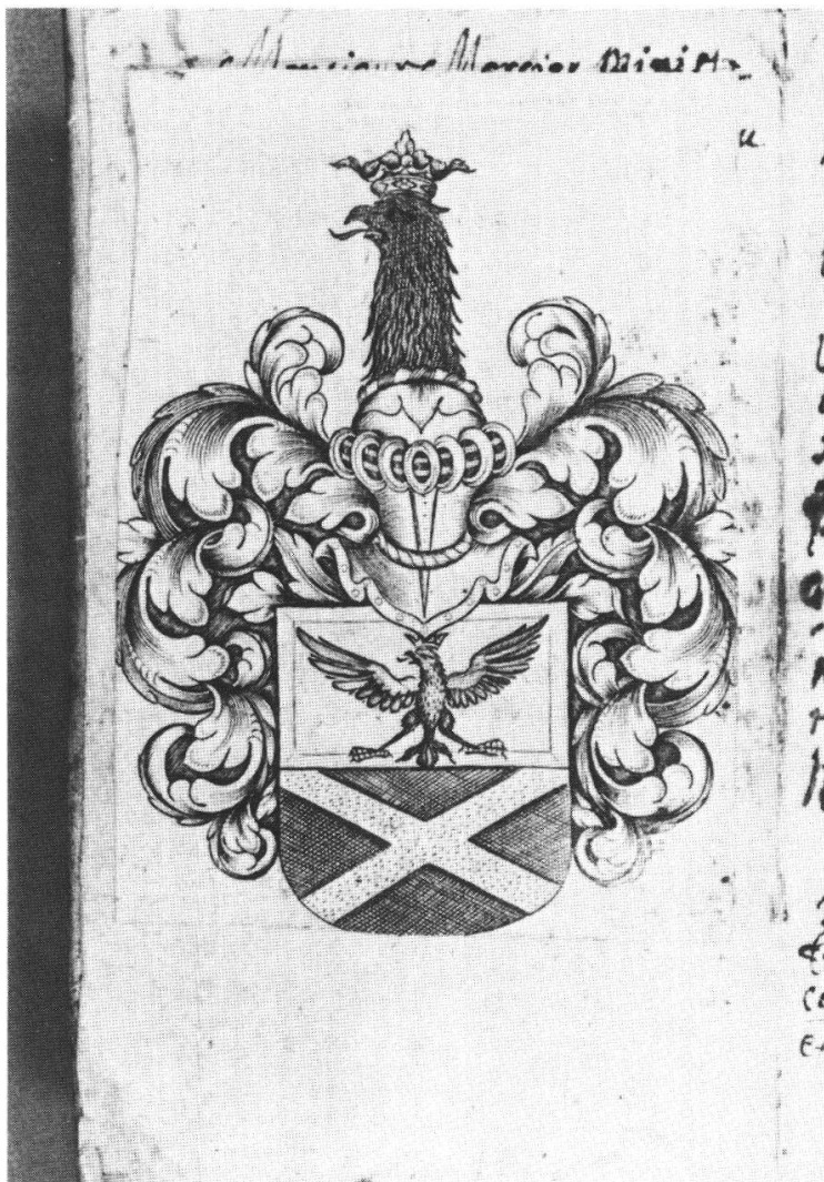
Fig. 5. Ex-libris de Jacob Constant de Rebecque.