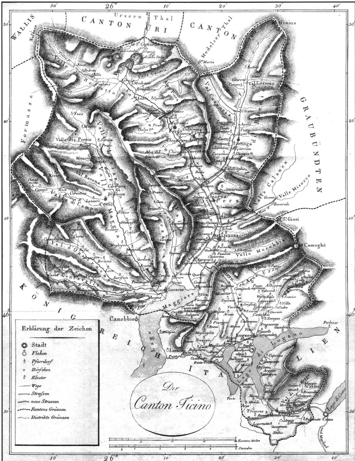
Il Cantone Ticino all'epoca della Mediazione, PAOLO GHIRINGHELLI, « Topographisch-statistische Darstellung des Cantons Tessin », (Helvetischer Almanach für das Jahr 1812, Zürich)