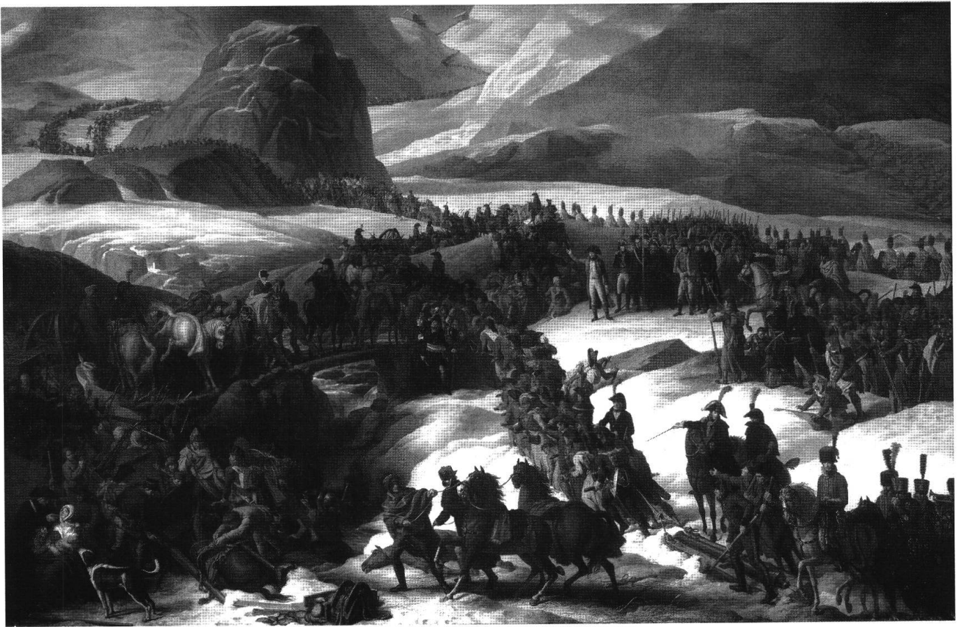
Charles Thevenin, Passage du Grand Saint-Bernard 1800 , 1806, huile sur toile (Château de Versailles)