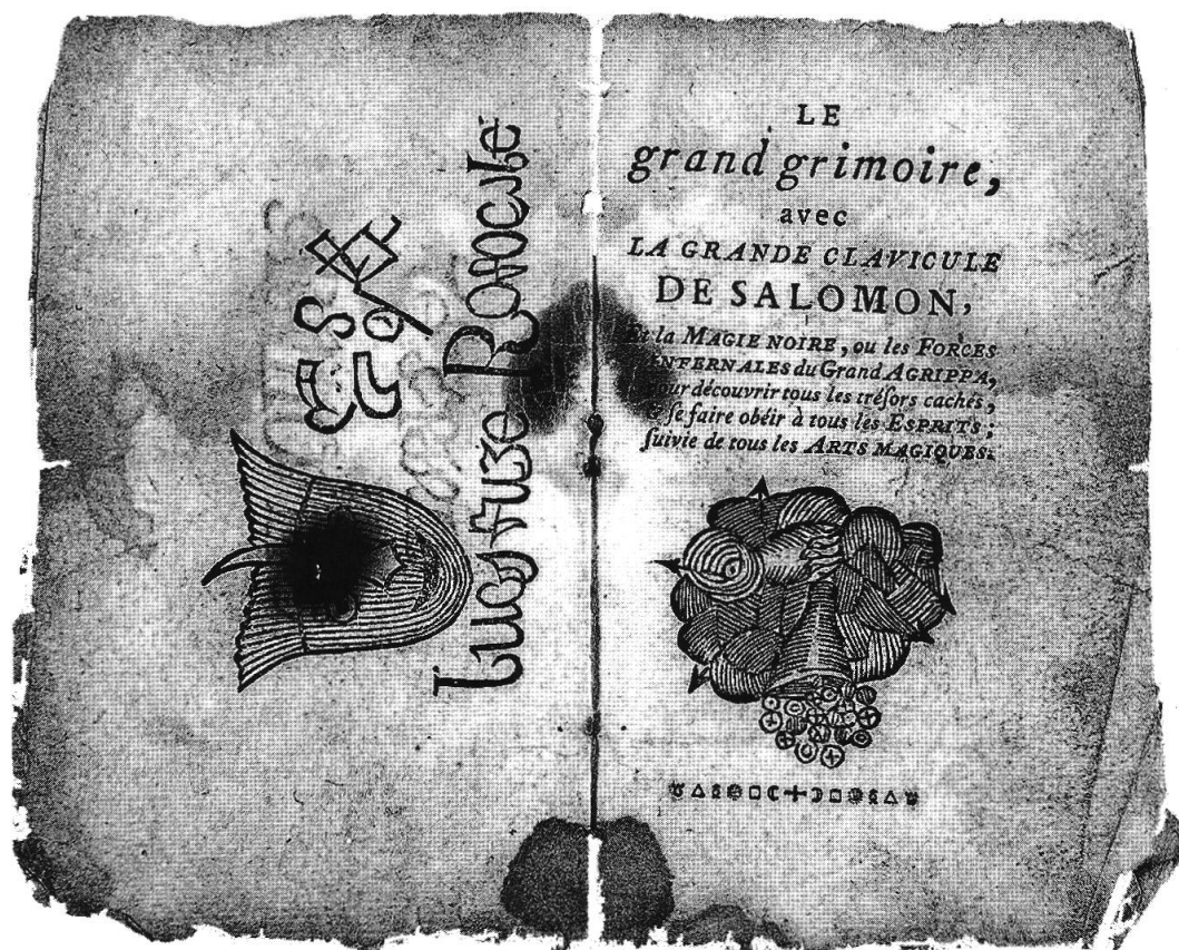
Fig 2 : Le grand grimoire, avec la grande clavicule de Salomon [...]

Mentionné comme pièce à conviction lors d'un procès, ce grimoire fut transmis par le Tribunal au Département de législation pour enquête afin de déterminer s'il avait été imprimé dans une des imprimeries du canton. « Le citoyen Lörtscher, associé de Chenebié, tient assez de tout. Il m'a certifié qu'il n'avait ni reçu ni demandé de ces petits livres de magie, qu'il savait cependant qu'ils s'imprimaient à Lyon et que tous les libraires de Genève en étaient pourvus. La folie actuelle du peuple et de certaines gens, qui ont cependant quelque instruction, c'est de chercher des trésors cachés ; pour cela, il faut avoir des conférences avec le diable, mais la difficulté consiste à le faire paraître et obéir et c'est le secret que doivent contenir ces livres. » (Rapport du juge du cercle de Vevey, De Mellet, 2 juillet 1805 ; ACV, K VII d 15, « Brochures »)