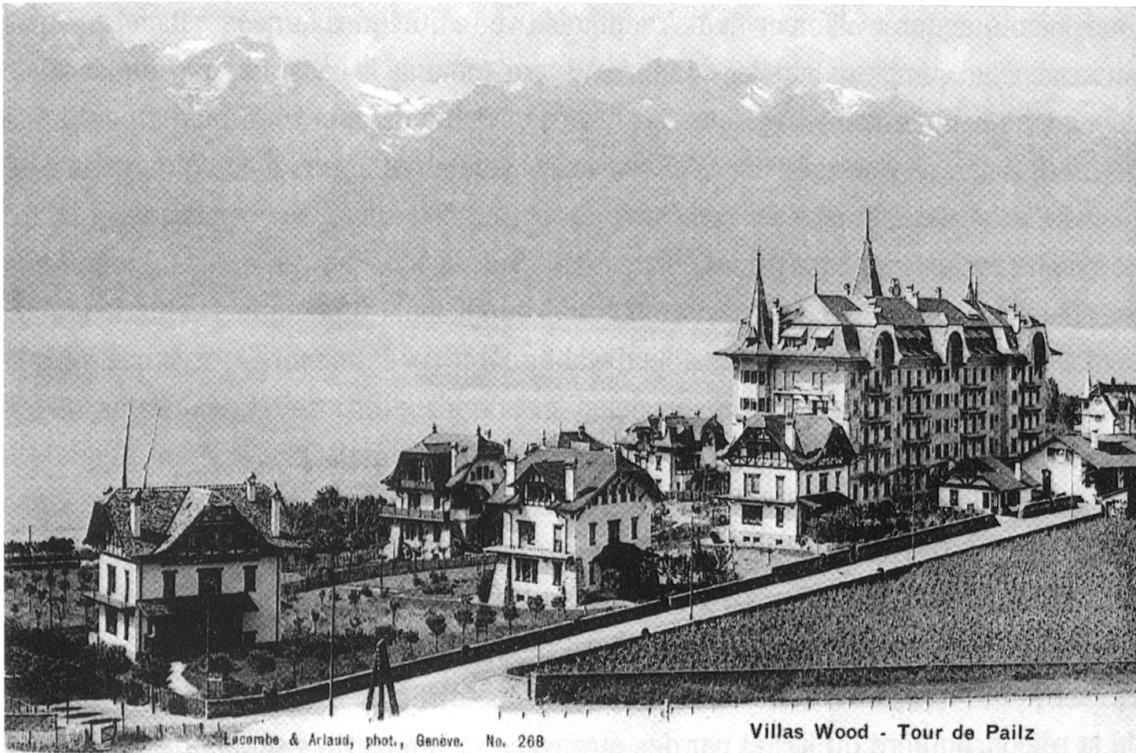
3 Quartier Bellaria, vue d'ensemble depuis le nord. Carte postale, vers 1905.

architectural régional; le Bulletin Technique de la Suisse Romande rapporte qu'ils ont « cette volonté de rapporter leur art à ces formes [traditionnelles de notre pays] », insinuant par là qu'il n'est guère étonnant qu'ils aient été choisis pour la construction d'un ensemble de bâtiments aux traits « typiques de notre pays » 79 .