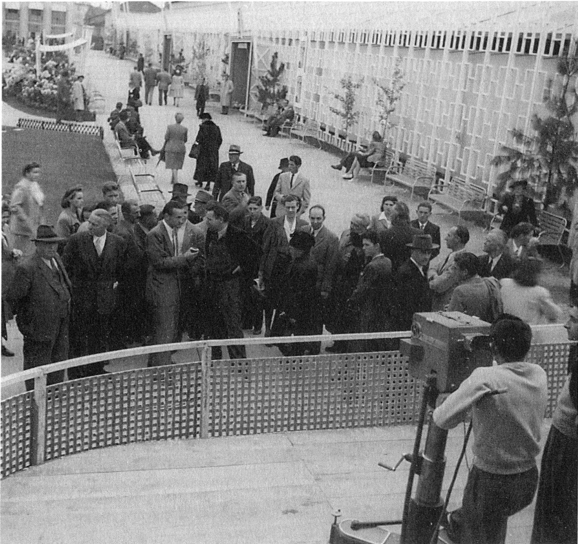
Essais et démonstrations de télévision à Lausanne, Comptoir suisse, Palais de Beaulieu, 1947

monde » 7 , restèrent parkées durant les quinze jours de la foire nationale d'automne, à côté du pavillon spécial érigé dans les jardins du Palais de Beaulieu. Le dispositif comprend un studio et une salle de 200 à 240 places dans laquelle sont diffusées, sur trois écrans de 850 lignes, les « visions captées au loin » et « piquées sur le vif par les caméras dont le champ d'investigation s'étend sur un rayon de 100 à 150 mètres ». Deux installations, l'une émettrice, l'autre réceptrice, assurent la transmission des images en circuit fermé, « avec un synchronisme parfait ».