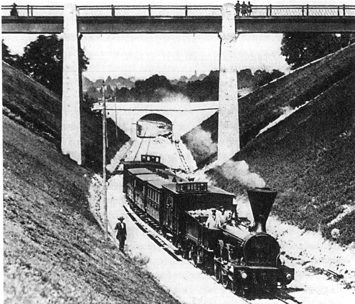
1 Les débuts du chemin de fer à Lausanne : train de l'Ouest-Suisse dans la tranchée du Languedoc en 1856-1857 (photographie, Musée historique de Lausanne).

chargée de statuer sur la Loi fédérale sur l'établissement et l'exploitation des chemins de fer , prône une construction étatique, les Chambres décident pourtant de confier l'exécution du réseau ferroviaire aux cantons et aux compagnies privées 6 . L'option défendue par le futur « baron » des chemins de fer Alfred Escher s'impose, ouvrant ainsi la voie à un demi-siècle d'exploitation privée des chemins de fer.