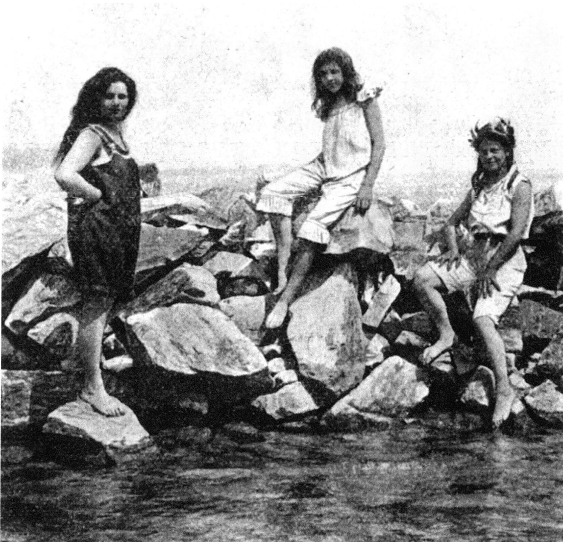
2 Lors du «Championnat suisse et du Léman» du 21 juillet 1907 à Genève, trois nageuses étaient engagées (photo parue dans La Suisse Sportive , 3 août 1907).

Pourtant, un Championnat «suisse et du Léman» se déroule le 21 juillet 1907 à Genève auquel La Suisse Sportive donne un large écho. Outre une photographie des trois nageuses qui participent à cette compétition, l'article, paru le 3 août, en contient deux autres. Alors que la première montre le concours artistique de plongeon, la seconde présente les dirigeants de la FSN. Parmi eux se trouve le président, M. A. Schindler. Le contenu de l'article relève que le Comité d'organisation a dû «se passer de concours sur lesquels il croyait pouvoir compter», ce qui peut laisser entendre soit que les autorités genevoises ne l'ont guère soutenu, soit que la Fédération elle-même n'a pas été à