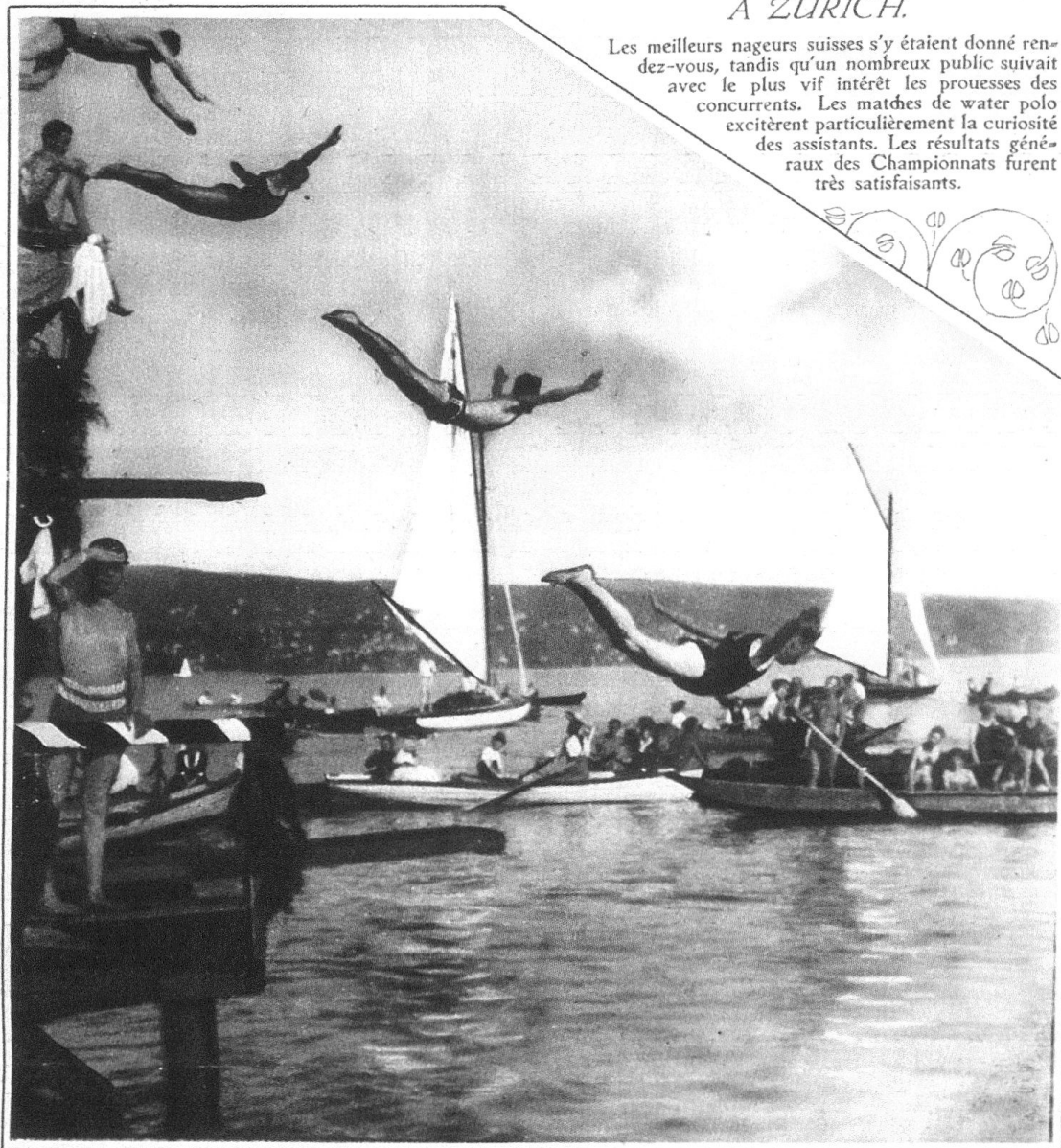
Un intéressant instantané du concours de plongeurs.

Les meilleurs nageurs suisses s'y étaient donné rendez-vous, tandis qu'un nombreux public suivait avec le plus vif intérêt les prouesses des concurrents. Les matches de water polo excitèrent particulièrement la curiosité des assistants. Les résultats généraux des Championnats furent très satisfaisants.