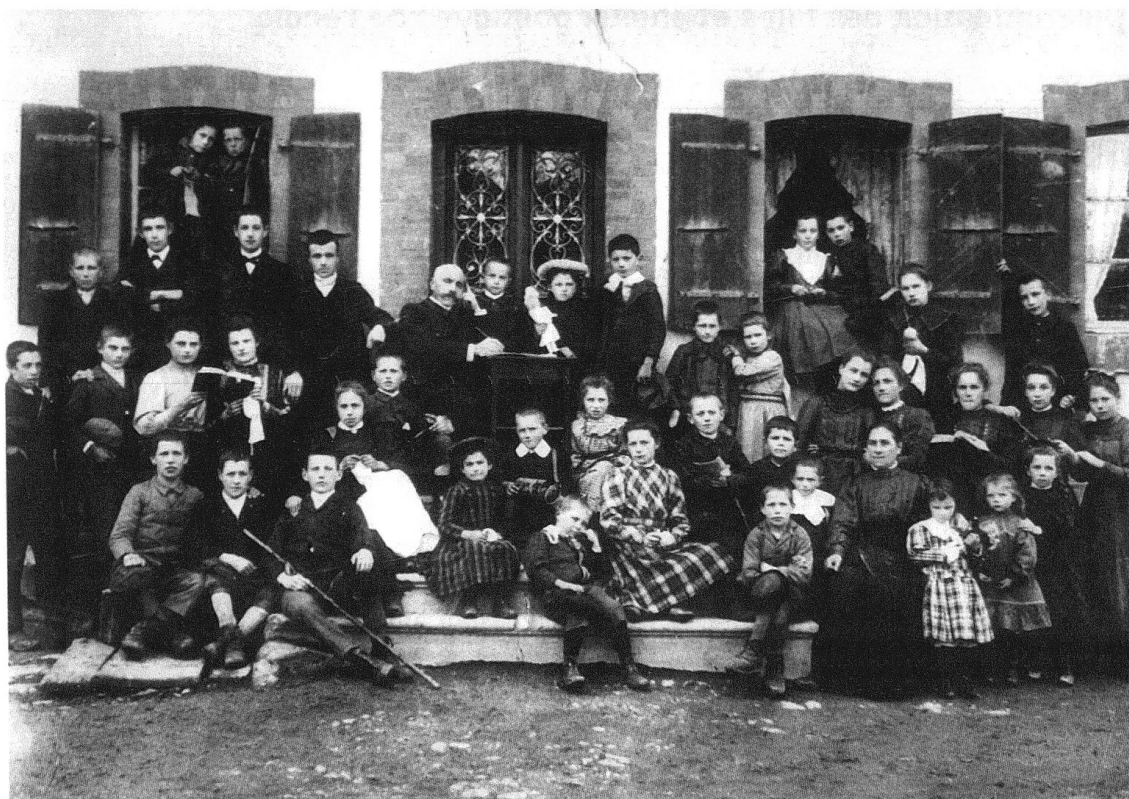
2 École villageoise dans un village vaudois aux alentours de 1900. La classe des petits et la classe des grands se mettent en scène pour la photographie souvenir, avec l'institutrice et l'instituteur. Selon la loi scolaire vaudoise, la séparation par âges est préférée à la séparation par sexes lorsque l'effectif global dépasse un certain nombre d'élèves.