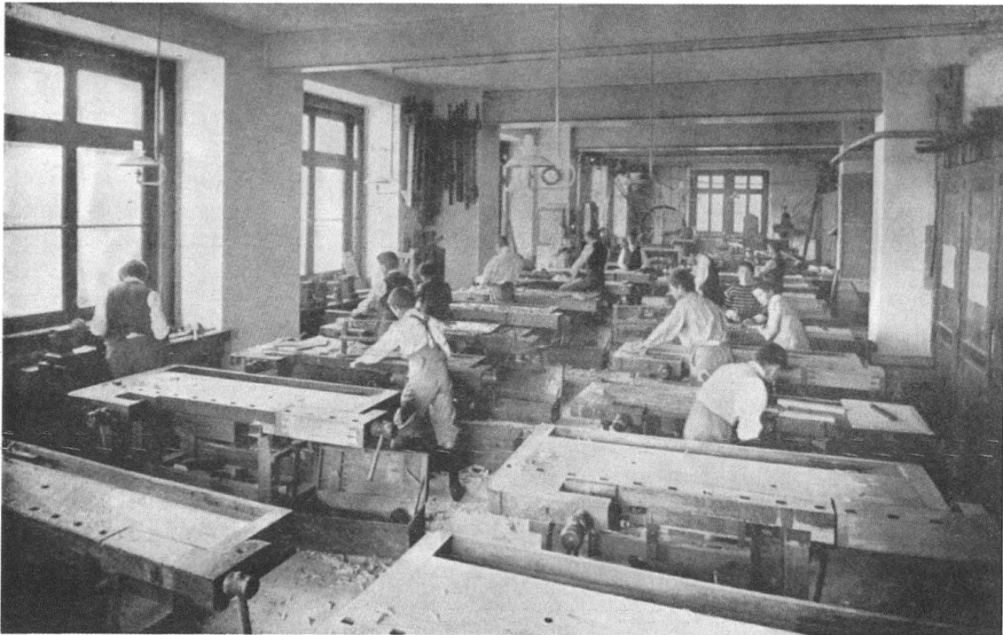
1 AaVv, L'école industrielle cantonale, notice historique , Lausanne: Payot, 1902, p. 200, photographie de l'auteur.

pourquoi se pencher sur cette période? Parce que c'est bien durant les décennies qui précèdent la Seconde Guerre mondiale qu'ont été réunies les conditions nécessaires à sa généralisation postérieure. Nous relevons, d'une part, la création des infrastructures et des structures comme les cours professionnels et les méthodes d'enseignement, la formation des enseignants, les programmes d'apprentissage, les organes de surveillance des conditions d'apprentissage, les examens de fin d'apprentissage et, d'autre part, l'adoption de la législation permettant de coordonner et dynamiser toutes ces activités.