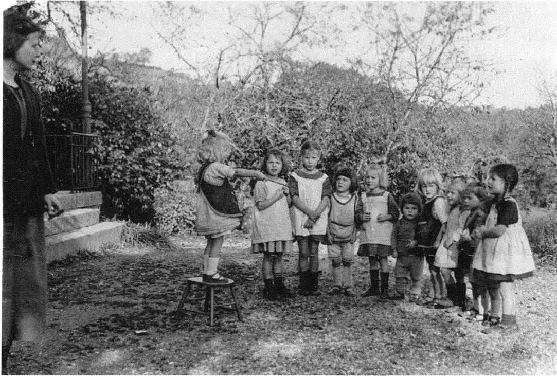
4-5 La même prise de vue comporte une différence importante selon qu'elle est destinée au public pour la page de couverture du Rapport sur l'activité durant 1924 (Archives Home « Chez Nous ».) ou à un usage privé dans l'album de photographies d'une ancienne élève. La vraie directrice de ce chœur d'enfants n'est probablement pas celle qui tient la baguette.