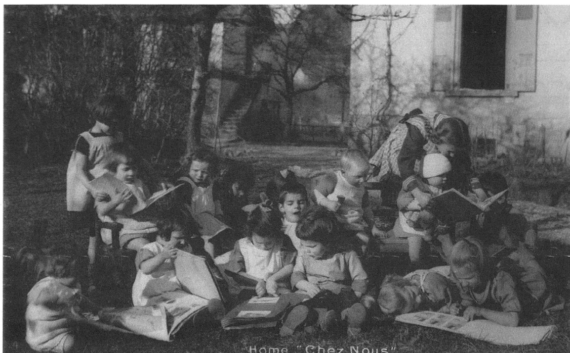
3 Carte postale mettant en scène l'intérêt spontané d'un groupe d'enfants studieux. Archives Institut Jean-Jacques Rousseau, Fonds Adolphe Ferrière.

À y regarder de près, cette enfance admirable est finalement la préfiguration d'un monde adulte idéal. La touche humoristique que donnent au film les conduites un peu malhabiles de ces petits mimant la sagesse des grands appelle la connivence et nourrit l'espoir d'une régénération possible de la société après la Grande Guerre. En alliant à la fois le charme exquis de l'innocence enfantine et la sérénité vertueuse d'une maturité responsable, la communauté du Home « Chez Nous » donne à voir le rêve de l'« homme nouveau » 10 que les pédagogues de l'« Éducation nouvelle » entendent réaliser avec leurs propositions rénovatrices. Les spectateurs ne sont donc pas conviés à la contemplation d'une éducation précocement terminée; ils sont invités à apprécier les signes des bonnes dispositions enfantines et à y voir autant de promesses d'un futur progrès social. Ces essais maladroits d'attitudes responsables ne nourrissent-ils pas l'espoir d'un avenir radieux ?