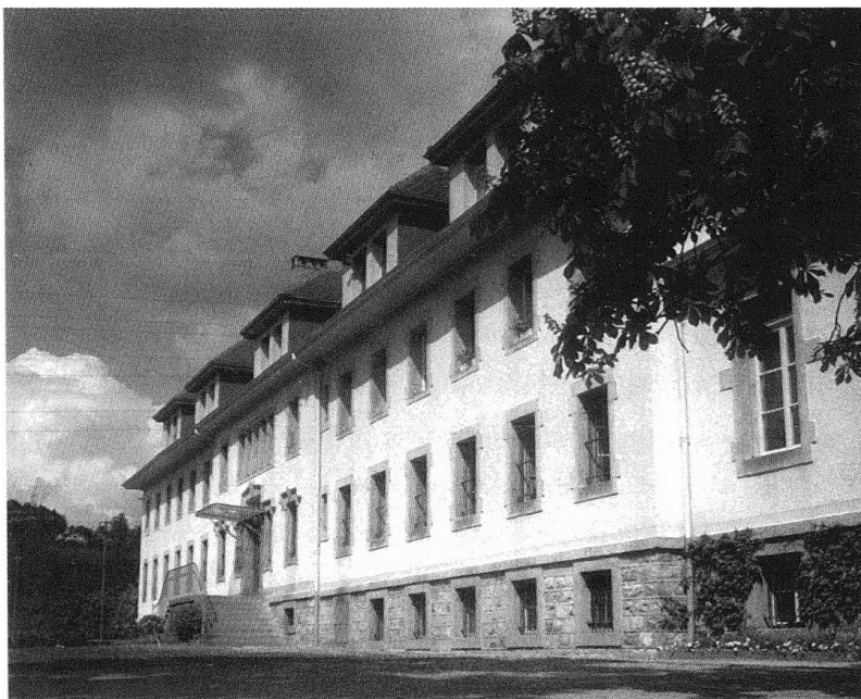
2 Entre prison et école. Bâtiment cellulaire construit en 1899-1900 sur le modèle carcéral au moment où l'École de réforme va remplacer la Discipline.

Archives du Centre d'orientation et de formation professionnelles COFOP.