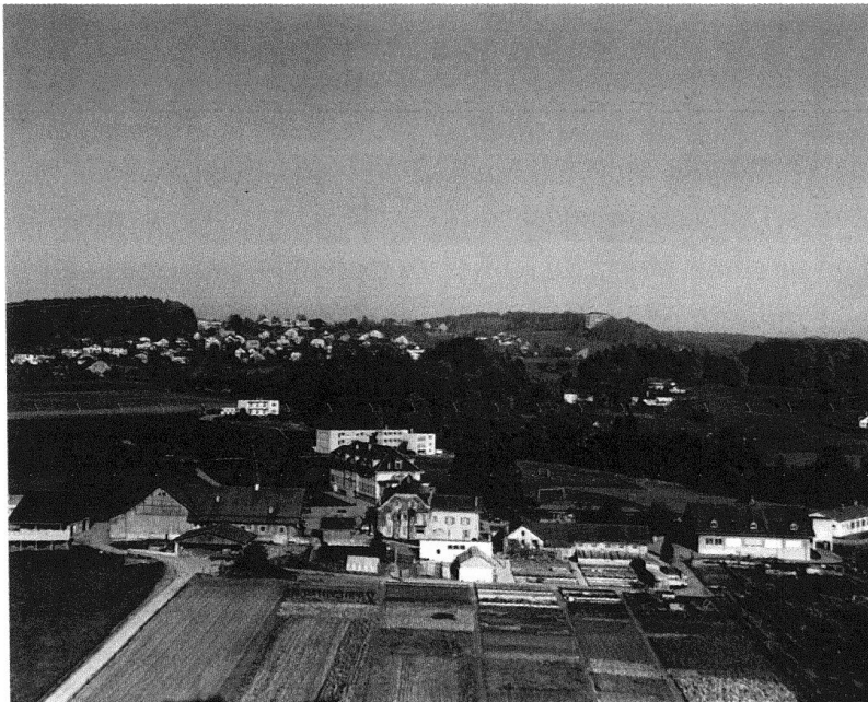
1 Le site de la Maison d'éducation de Vennes vers 1970 où l'on peut lire les étapes de l'institution: les anciens bâtiments de ferme de la Discipline des Croisettes (1846), le bâtiment cellulaire de l'École de réforme (1902) et les pavillons de la Maison d'éducation de Vennes (1967).