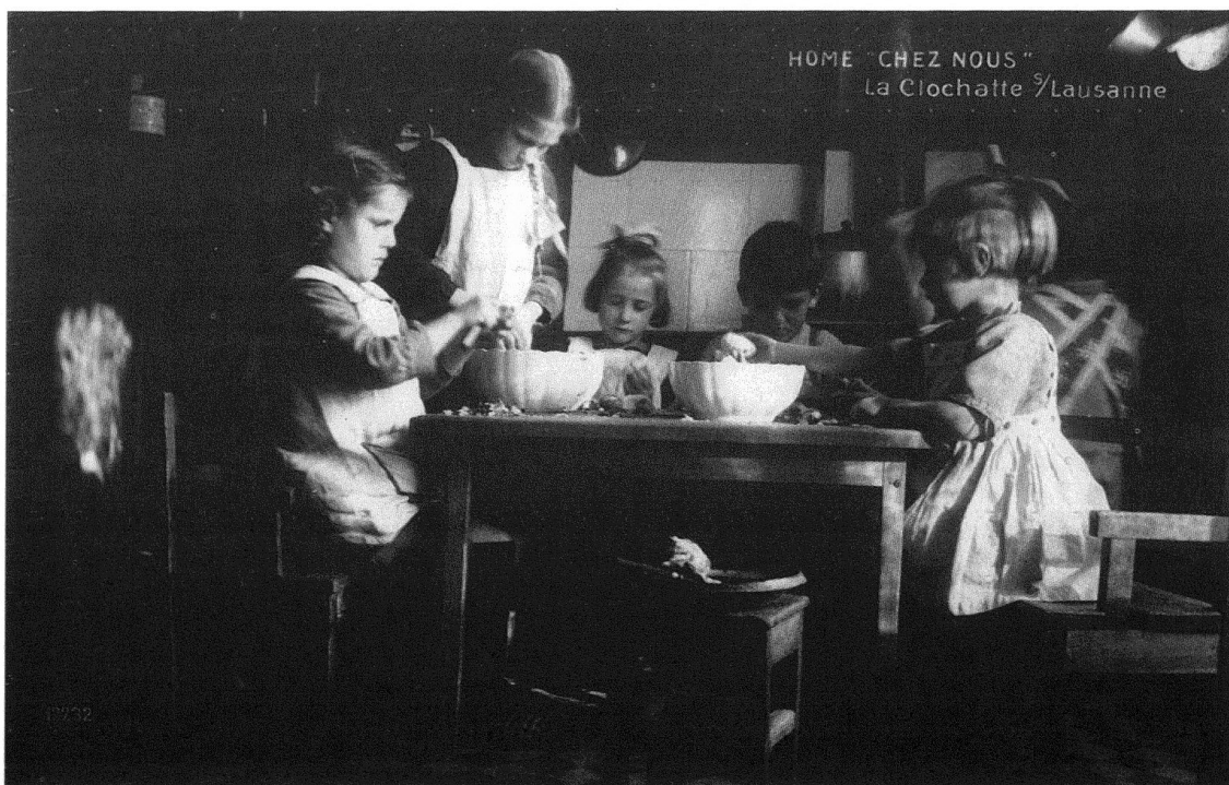
1-2 Cartes postales éditées par le Home « Chez Nous », montrant des enfants de l'institution qui se débrouillent sans adulte dans la vie quotidienne.