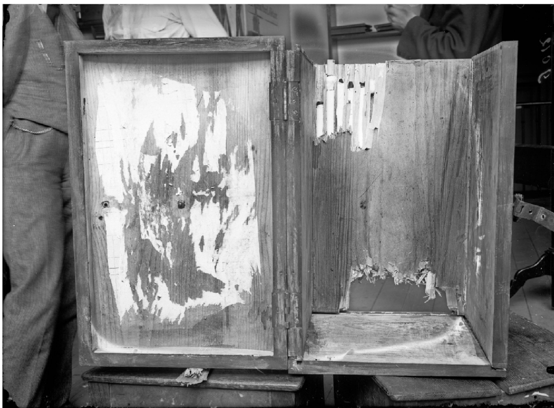
5 Valise suspecte trouvée à la gare de Lausanne en août 1916, © IPS: Reiss découvre cachés dans les parois 36 tubes d'explosif. Cliché par R. A. Reiss.

Reiss décrit l'objet, prend ses dimensions, note qu'elle est vide. Un détail troublant le met sur la voie: bien qu'elle soit apparemment vide, lorsqu'il frappe aux parois, celles-ci lui paraissent pleines. Un démontage s'impose: à coups de marteau, Reiss enlève les planches latérales de la valise et découvre que 36 tubes y sont logés.