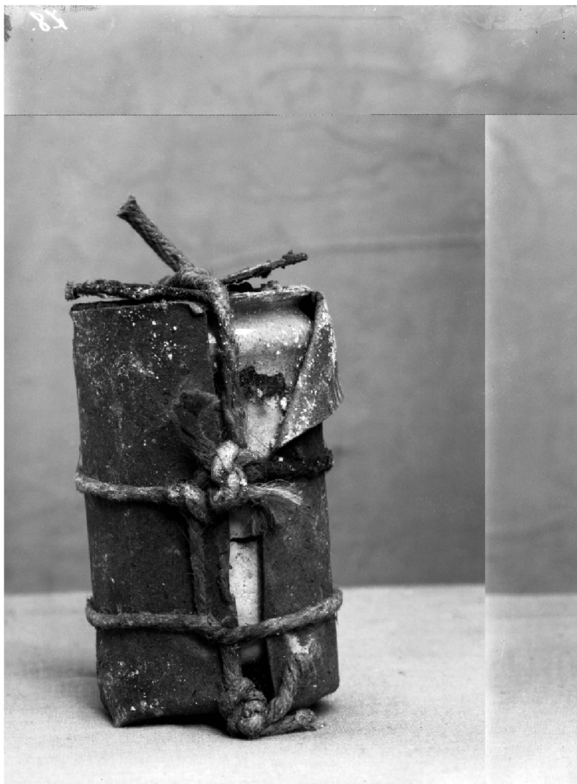
1 Engin trouvé devant la Banque cantonale vaudoise en 1906, cliché de R. A. Reiss, © IPS 9 .