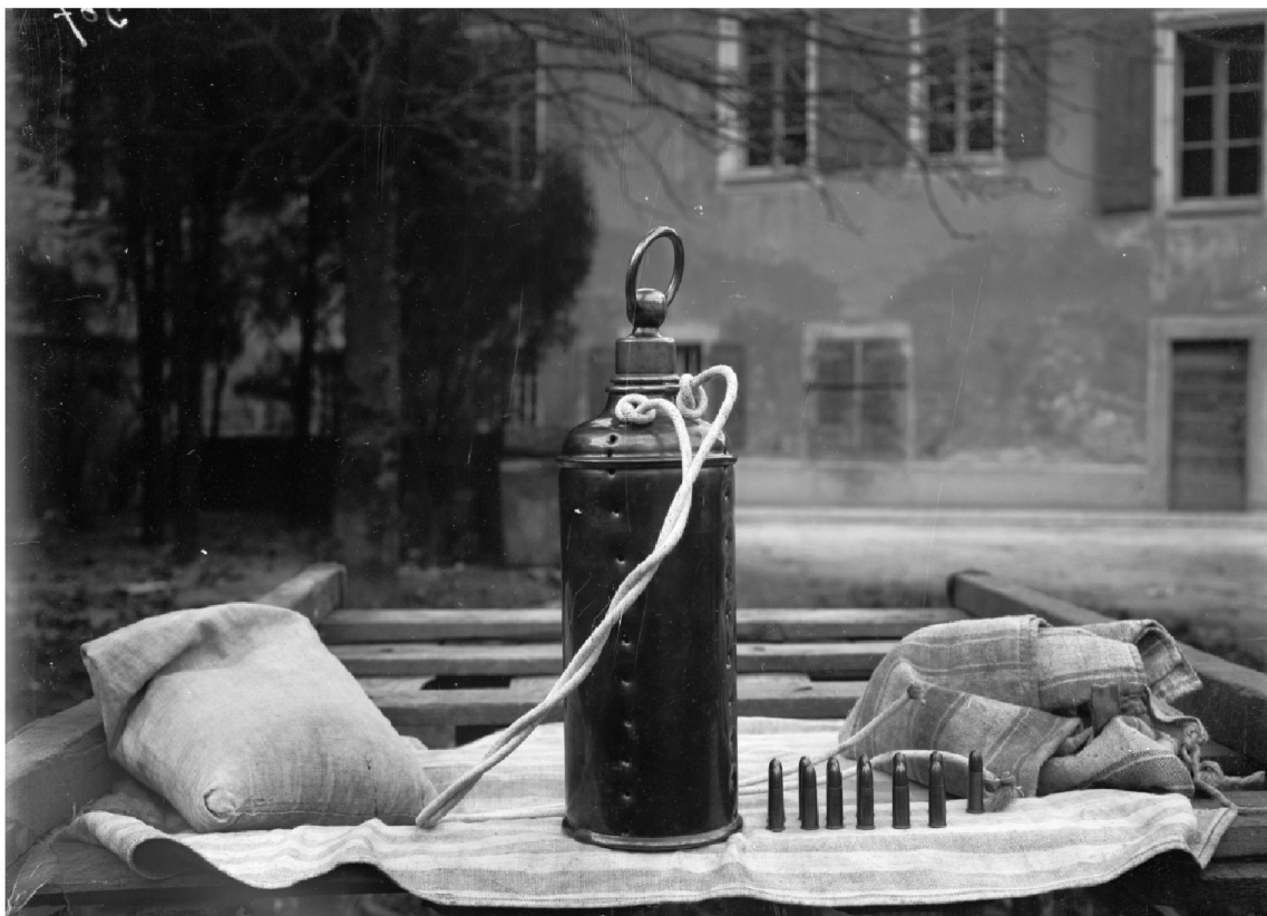
2 Engin explosif retrouvé sur la voie ferrée à Villeneuve dans un sac rempli de sciure de bois (canton de Vaud), cliché de R. A. Reiss, 1906, © IPS.

la substance explosive. Il s'agit d'un mélange de plâtre, de sulfure de fer en morceaux et d'un peu de soufre. La couche inférieure de l'engin contient un peu de bichromate de potassium et des briques de verre assez épaisses. Dans l'éprouvette, l'expert découvre du plâtre et du bichromate de potassium ainsi qu'une mèche qui va jusqu'au fond. Ce qui devait être une bombe se révèle être au terme de l'analyse un objet tout à fait inoffensif. Se basant sur les produits employés, Reiss conclut en dressant un portrait sommaire de l'auteur. Celui-ci pourrait être un étudiant en chimie ou un pharmacien, voire une personne ayant libre entrée dans des laboratoires chimiques ou pharmaceutiques.