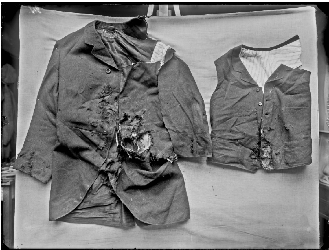
4 Jaquette et gilet d'une victime de l'explosion d'une bombe en gare de Sion, cliché de R. A. Reiss, 1907, © IPS.

déflagration. Ils y découvrent aussi des taches jaunâtres formées d'une matière collante et sablonneuse.