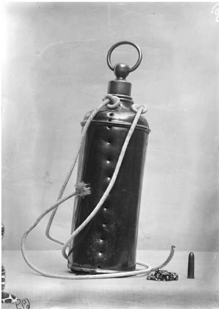
3 Engin explosif retrouvé sur la voie ferrée à Villeneuve (canton de Vaud), cliché de R. A. Reiss, 1906, © IPS.