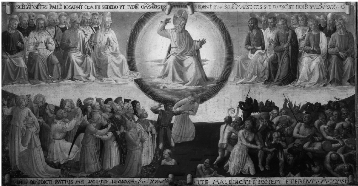
4 Fra Angelico, Jugement dernier , détail de l'armoire des vases sacrés de l'église de l'Annunziata, vers 1450, tempera sur bois, 38,5 × 75 cm, Florence, Museo di San Marco, © Ministero per i Beni e le Attività Culturali SSPSAE e per il Polo Museale della città di Firenze, Gabinetto Fotografico.