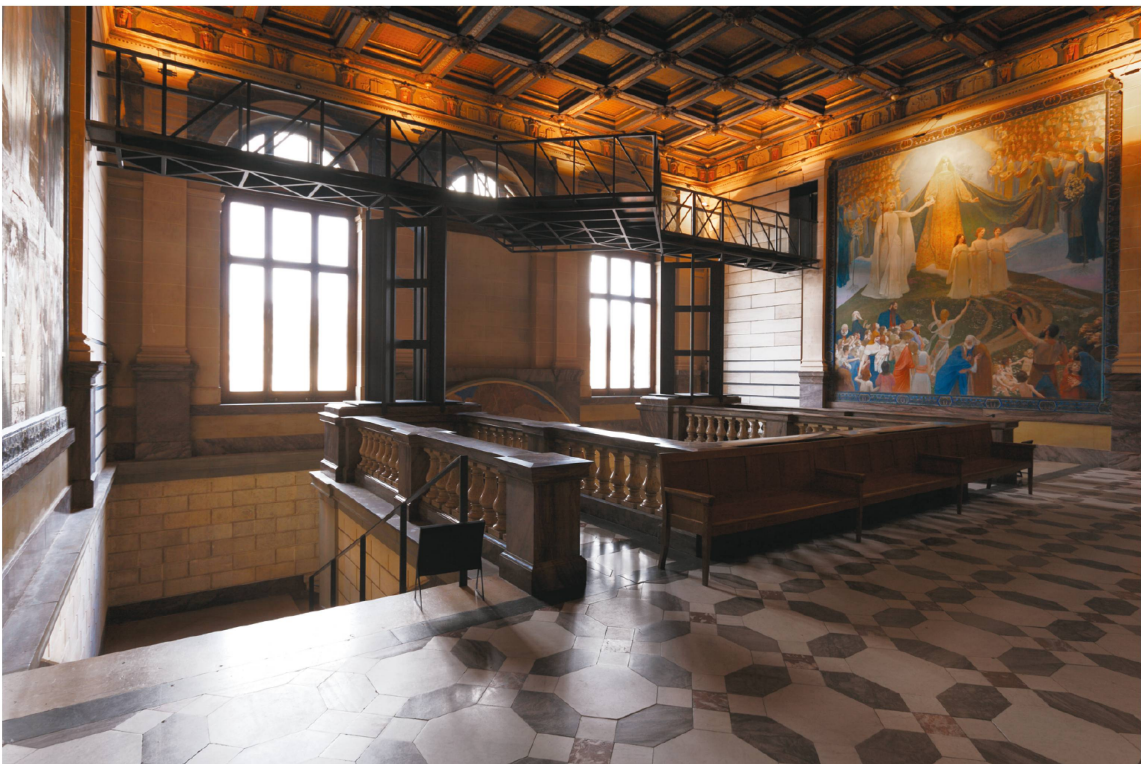
2 Vue d'ensemble de la cage d'escalier du Tribunal de Montbenon , Lausanne, © Musée historique de Lausanne, A. Conne.