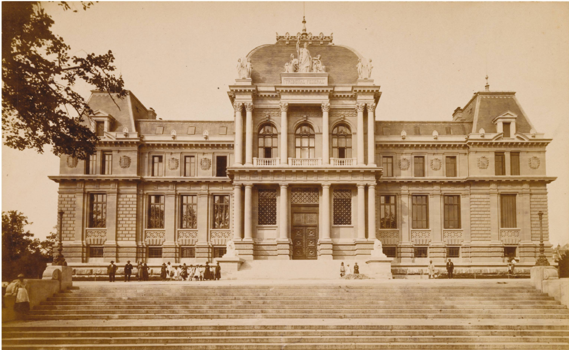
1 A. Garcin, Vue de la façade sud du Tribunal de Montbenon , Lausanne, 1886, photographie, © Musée historique de Lausanne.