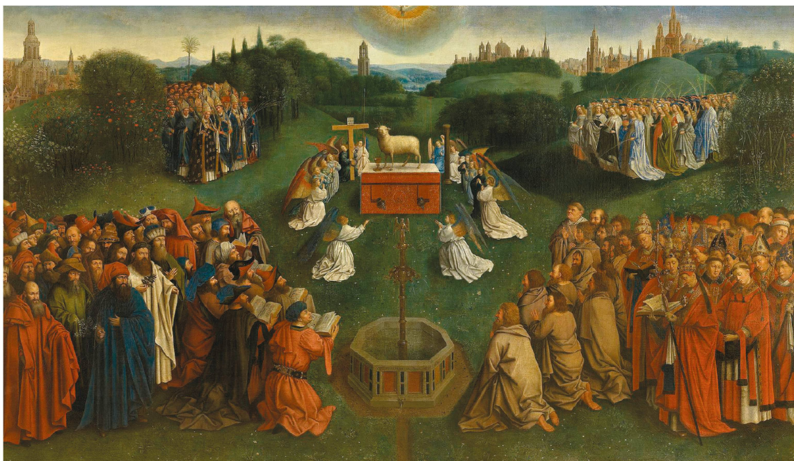
5 Hubert van Eyck et Jan van Eyck, Adoration de l'Agneau mystique, élément central du registre inférieur du retable de Gand, 1423-1432, huile sur bois, 137,7 × 242,3 cm, Gand, Cathédrale Saint-Bavon