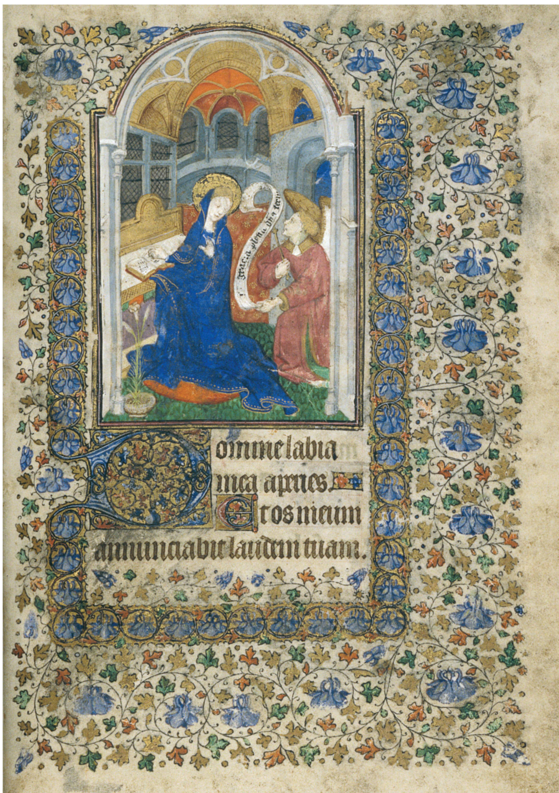
Fig. 3. Thème de l'Annonciation dans le Livre d'Heures de Jehan de Gingins. 1421. L'Annonciation constitue toujours le motif principal de ce type de documents. © Archives cantonales vaudoises, ACV, P Château de La Sarraz, H 50, f. 194r, photo Olivier Rubin.