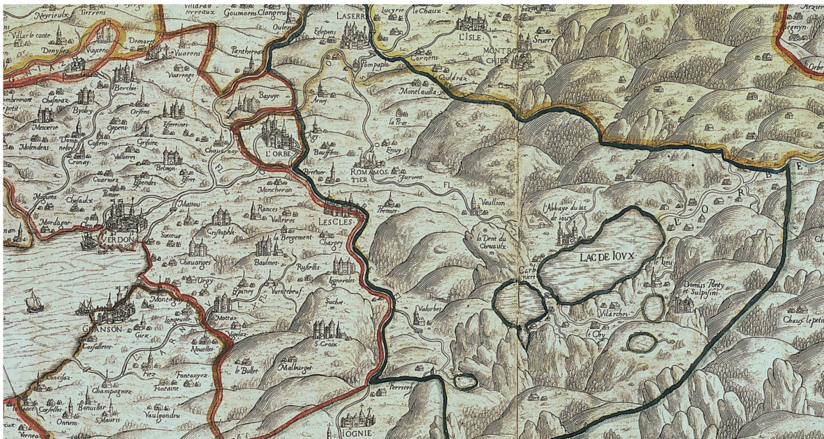
Fig. 6. Carte du Pays de Vaud par Thomas Schoepf, 1577. Gravure en taille-douce avec surcharges en couleur, 46 x 65 cm. Échelle approximative 1 : 100 000. La Lance, Romainmôtier, Lac-de-Joux, Le Lieu, Domus Pontii . Détail.

l'ermitage de Pontius y figure, toujours avec une légende latine sans pareille sur la carte Domus Pontii et Sulpisini . En résumé, il y a donc pour Schoepf trois catégories d'anciens établissements religieux : ceux qui ont été supprimés anciennement, ceux dont, après la suppression par Berne, les biens ont été simplement amodiés sans réutilisation des bâtiments, enfin ceux qui ont été intégrés dans le nouveau système administratif.