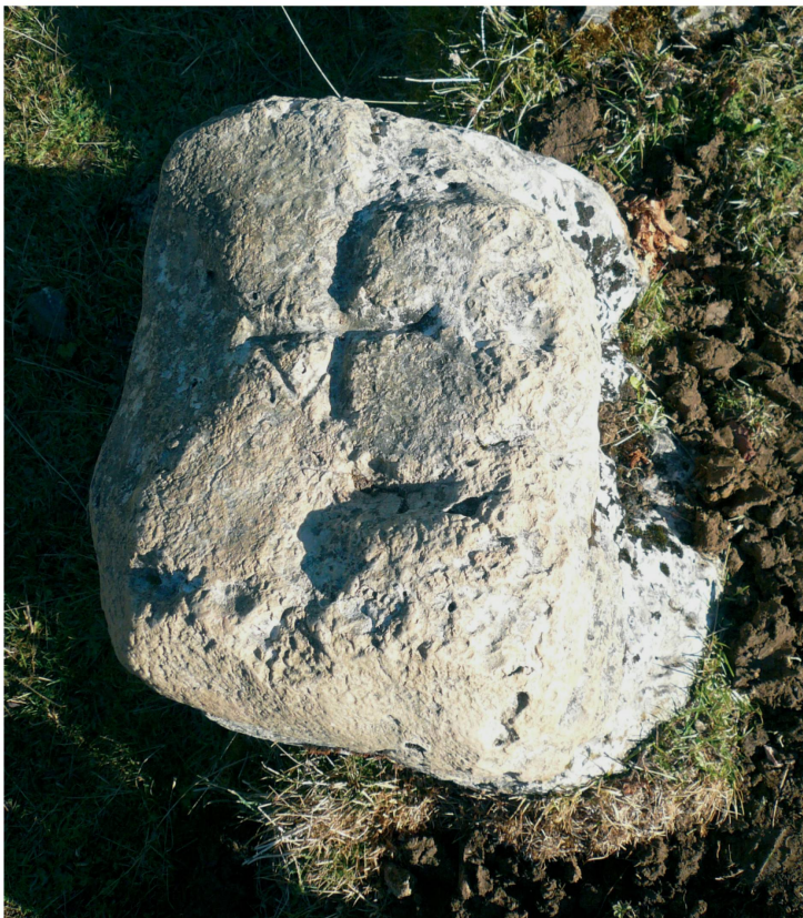
Fig. 2. Borne à l'entrée d'un ancien pâturage de la chartreuse d'Oujon. Face supérieure.