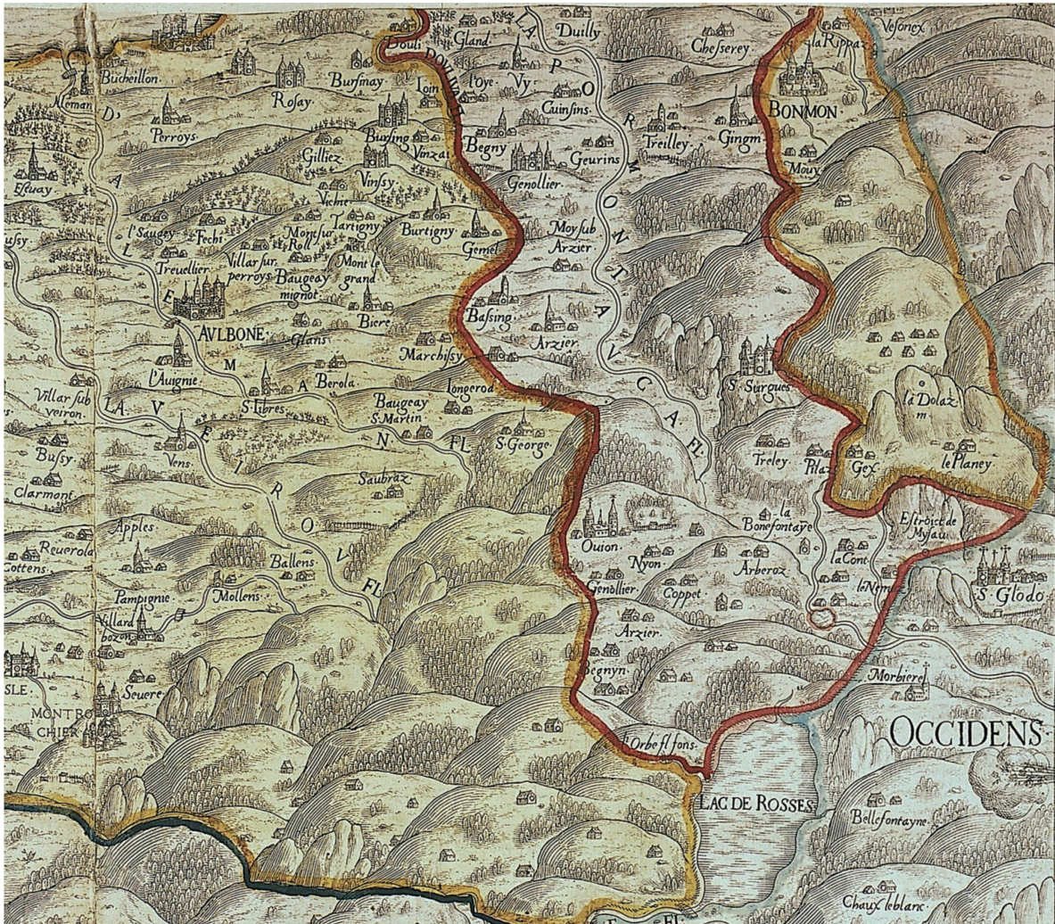
Fig. 4. Carte du Pays de Vaud par Thomas Schoepf, 1577. Gravure en taille-douce avec surcharges en couleur, 46 x 65 cm. Échelle approximative 1:100 000. Oujon, Bonmont, Saint-Claude. Détail.

le signe conventionnel sans équivoque et l'emplacement sur le côté ouest (droit) de la combe signalent en fait l'ancien château (emblème de pouvoir) et non le village, ce qui est très significatif. La chartreuse est entourée de fruitières désignées par le nom des communes qui les font exploiter (Nyon, Coppet, Arzier, Begnins), et qui sont donc des réalités économiques enregistrées par le cartographe. L'église d'Oujon est figurée entre deux tours fantaisistes qui veulent peut-être évoquer les annexes du chevet ou une porterie. À côté, une clôture faite en partie d'un rideau d'arbres, avec un portail, pourrait suggérer un cloître entourant un préau planté de quelques arbres. Mais comme cet élément est bien distinct du groupe de bâtiments formé autour de l'église, on ne saurait exclure non plus qu'il puisse s'agir d'un dessin schématique de la maison basse (soit les bâtiments d'exploitation), supprimée probablement au début du XIV e siècle.