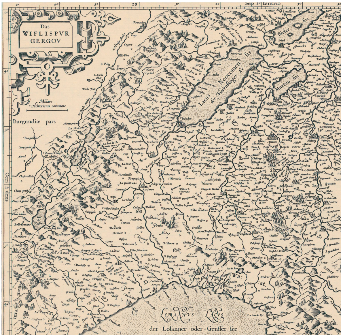
Fig. 8. Carte du «Wiflispurgergou» pour l’atlas de Gérard Mercator, 1585. Gravure en taille-douce, 36 x 47 cm. Échelle approximative 1 : 340 000. Détail.