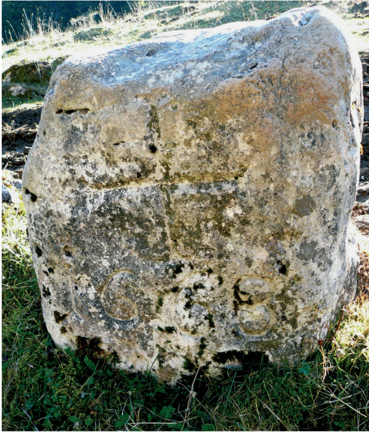
Fig. 1. Borne à l'entrée d'un ancien pâturage de la chartreuse d'Oujon. Face principale.