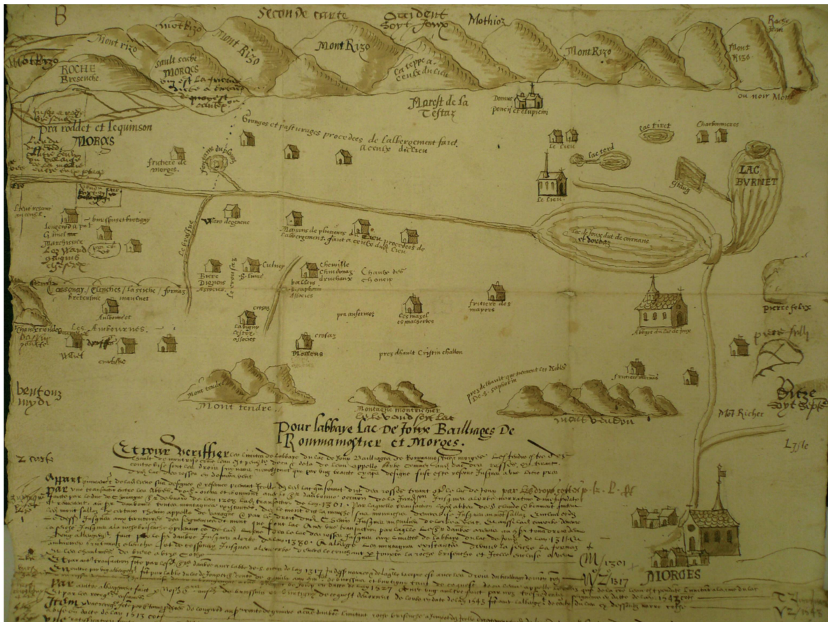
Fig. 3. Carte des négociateurs bernois mise au net, vers 1571. Baillivages de Romainmôtier et Morges. Détail. Dessin à la plume. © ACV, Bq 2. Photographie de l’auteur.

expansion). Ici aussi, c’est manifestement l’emblème du pouvoir territorial que l’on veut représenter.