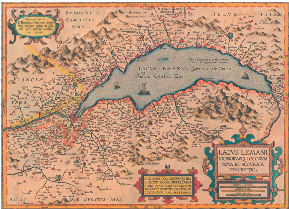
Fig. 9. Carte de la région lémanique, par Jacques Goulart, version Vriendt de 1607. Gravure en taille-douce avec surcharges en couleur, 37 x 51 cm. Échelle approximative 1 : 175 000.

Établie d'un point de vue plus lointain, la carte de la Suisse ( Helvetiae, Rhaetiae et Valesiae caeterorumque Confoederatorum ut & finitimorum Populorum Tabula Geographica et Hydrographica nova & exacta ), du Zurichois Hans Conrad Gyger (1599-1674) témoigne elle aussi, et pour les mêmes raisons que Mercator, d'emprunts à Schoepf. La version reproduite ici (fig. 10) a été gravée en 1657, assurément d'après des modèles plus anciens, parce qu'à ce moment, Gyger avait déjà mis au point la technique qui fait de lui un grand nom de l'histoire du dessin cartographique: la représentation du relief en plan, technique qui n'est ici qu'embryonnaire 18 . Cette qualité novatrice s'accompagne malheureusement d'erreurs assez grossières dans le réseau hydrographique et dans la situation des localités. Cependant, le choix des symboles pour les anciens établissements religieux n'est pas totalement arbitraire: abstraction faite de l'absence de l'abbaye d'Hautcrêt, on peut définir trois catégories: la première comprend