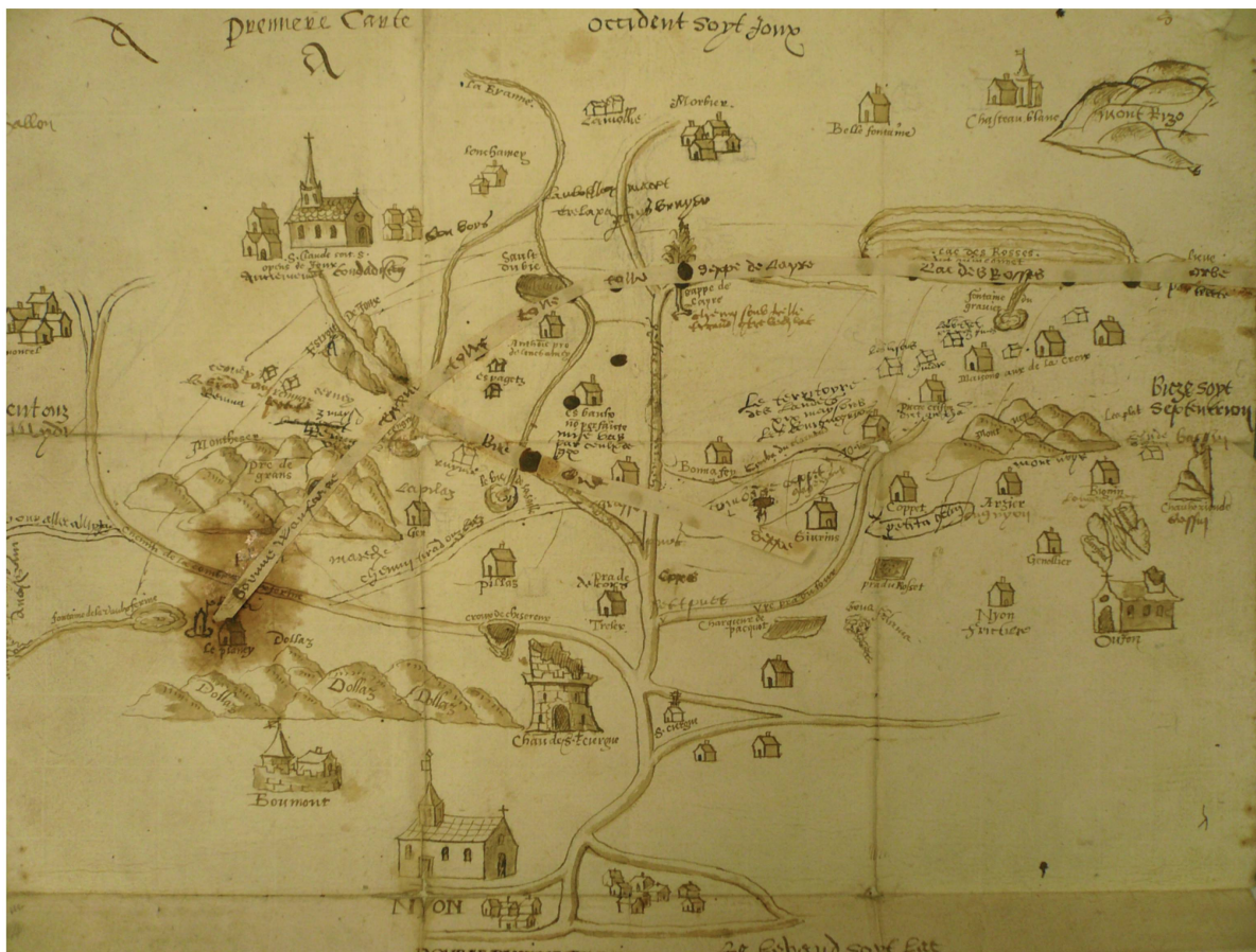
Fig. 2. Carte des négociateurs bernois mise au net, vers 1571. Bailliage de Nyon. Détail. Dessin à la plume.

cantonaux vaudoises possèdent un dossier d'esquisses au graphisme très sommaire 10 et un dossier de cartes plus élaborées, qui ont sans doute été emportées par les négociateurs 11 (fig. 2 et 3). Outre les lieux habités, ces cartes montrent des repères topographiques (montagnes, cours d'eau) et – élément important longtemps absent des cartes générales dont il sera question plus bas – les routes, qui nous révèlent la perception des enjeux stratégiques. Remarquons au passage aussi le soin mis à faire figurer les fruitières, signe de leur importance économique.