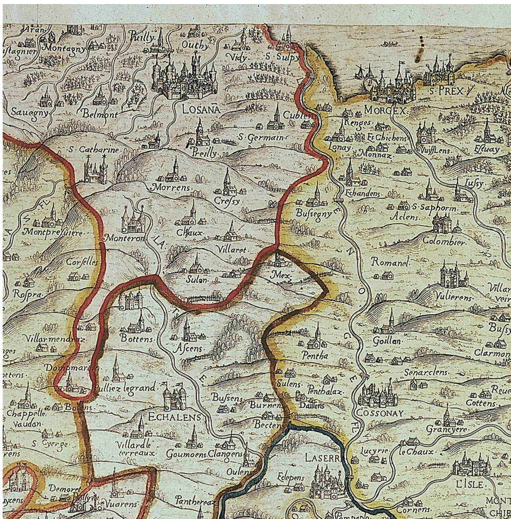
Fig. 5. Carte du Pays de Vaud par Thomas Schoepf, 1577. Gravure en taille-douce avec surcharges en couleur, 46 x 65 cm. Échelle approximative 1 : 100 000. Sainte-Catherine, Montheron. Détail.

En recensant les symboles utilisés pour illustrer les anciens couvents, on remarque que presque tous les établissements qui nous intéressent ici et qui ont été supprimés consécutivement à la conquête bernoise sont représentés par un symbole identique: deux tours encadrant une maison, avec une étoile sur chacune des tours. Ce détail est d'importance, parce qu'il sert à la distinction d'avec les monastères encore habités en terre catholique (par exemple l'abbaye de Saint-Claude, la chartreuse de La Valsainte, etc.), où les tours sont surmontées d'une croix grecque. Dans la catégorie des établissements supprimés figurés par ce symbole, on trouve Oujon, le Lac-de-Joux, Montheron, Sainte-Catherine et Hautcrêt. Font exception l'abbaye de Bonmont, alors administrée par un gouverneur, et la chartreuse de La Lance, devenue propriété privée d'un bailli bernois. Quant au Lieu, de suppression plus ancienne, il est représenté comme un village;