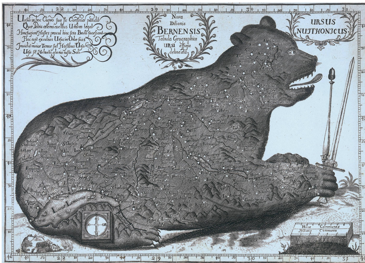
Fig. 7. Carte de la République de Berne en forme d'ours ( Nova ditonion Bernensis tabula geographica ursi effigie delineata ), par Jakob Störcklein, vers 1700. Gravure en taille-douce, 23 x 33 cm. Échelle approximative 1:800 000.

Montheron, Hautcrêt et Sainte-Catherine y sont représentés par un des symboles utilisés pour les villages.