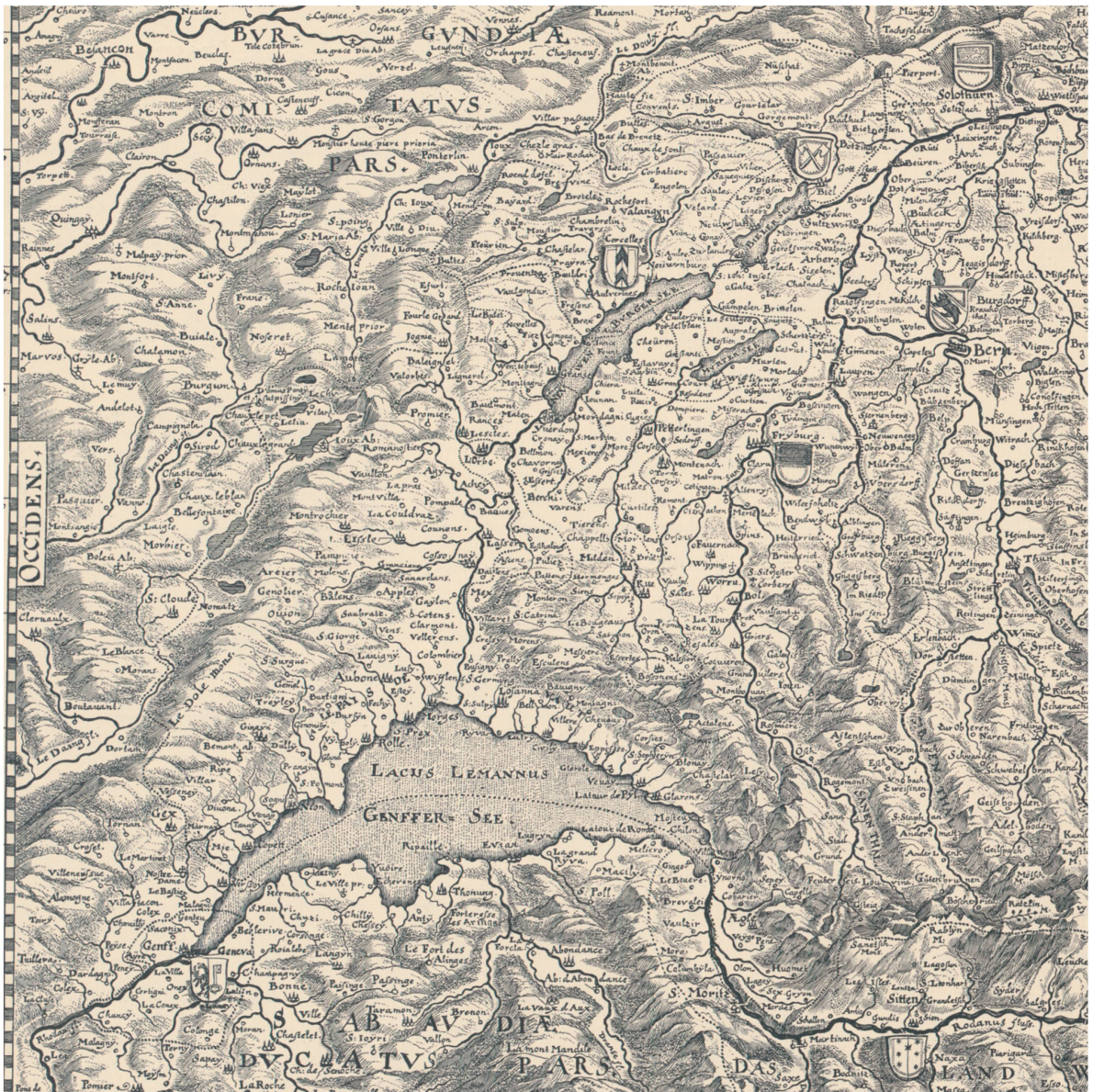
Fig. 10. Helvetiae, Rhaetiae et Valesiae caeterorumque Confoederatorum ut & finitimorum Populorum Tabula Geographica et Hydrographica nova & exacta (carte générale de la Suisse), par Hans Conrad Gyger, 1657. Gravure en taille-douce, 55 x 76 cm. Échelle approximative 1 : 500 000. Détail.