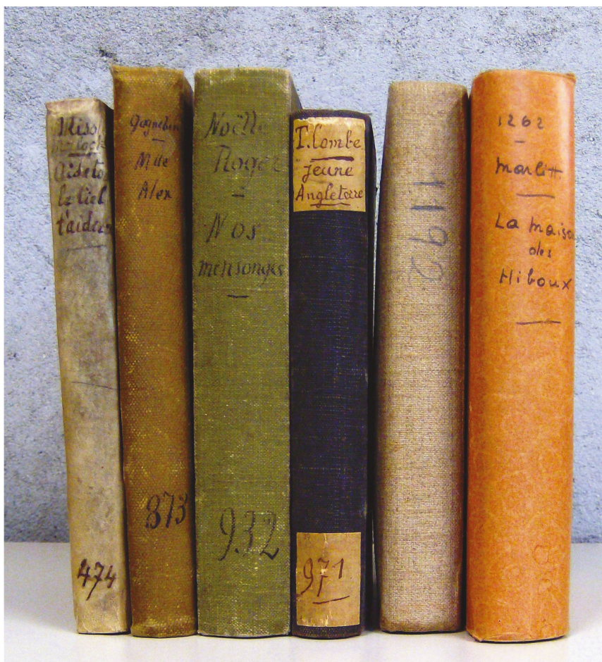
Fig. 1. Différents types de reliures, par ordre d'apparition dans le fonds.

fermeture en 1960. Si l'on peut penser que ces deux points ont pu contribuer au désintérêt des lecteurs à la fin de l'existence de la bibliothèque 10 , ils ont pour nous l'avantage de donner un aperçu non seulement de la composition du fonds, mais également de son évolution au fil des années.