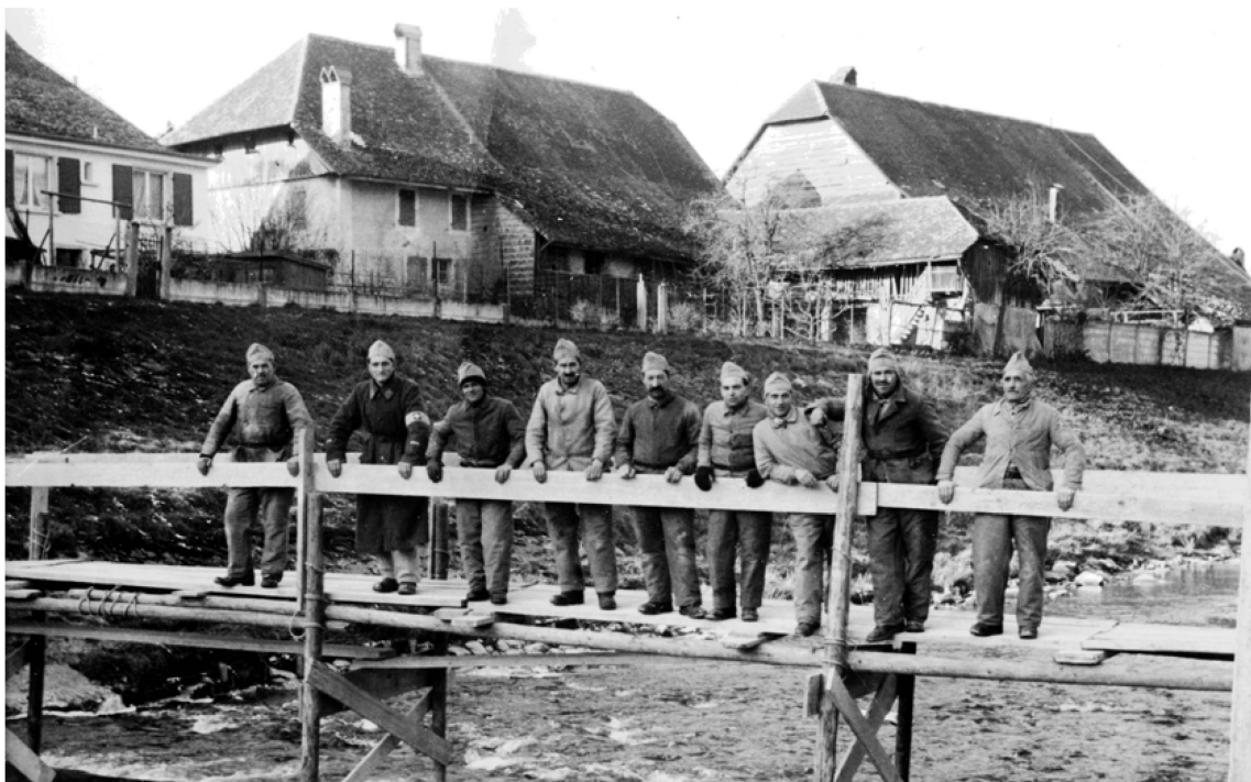
Fig. 6. Passerelle construite sur la Broye par le Service technique payernois. 1943.

a reçu l'ordre de mobilisation le 1 er septembre 1939, quelques heures après la mobilisation générale 28 . Assermenté le lendemain par le préfet du district comme toute troupe faisant partie de l'armée, il est mis de piquet le 8 septembre 1939 après quelques jours de service actifs seulement. Il a ensuite été mobilisé dans son entier de plusieurs façons différentes, lors des exercices d'alarmes, des cours d'instruction et exercices avec les différents services de DAP, et enfin lors des cours de répétition deux fois par an. C'est à cette occasion que le Service technique a par exemple construit une passerelle sur la Broye entre le quartier du Vuary et le quai de la Broye 29 . Un constat est que la mobilisation de l'organisme local était moins contraignante que celles des soldats aux frontières, la moyenne de jours de service de l'année 1943 étant de 34 30 . C'est durant ces jours qu'étaient compris les alertes et les contrôles d'obscurcissement, situations qui reflètent comment la DAP a réellement été perçue dans la cité broyarde.