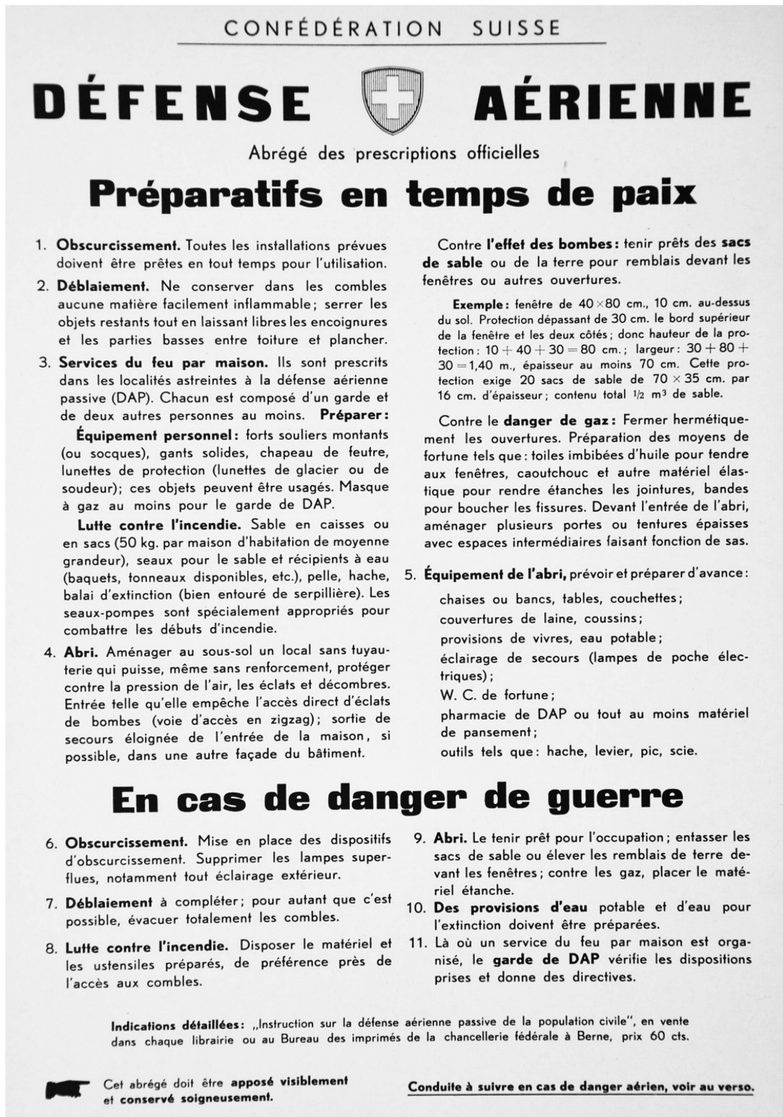
Fig. 4 et 5. Feuille cartonnée recto verso distribuée à tous les foyers, septembre 1938. ACP.