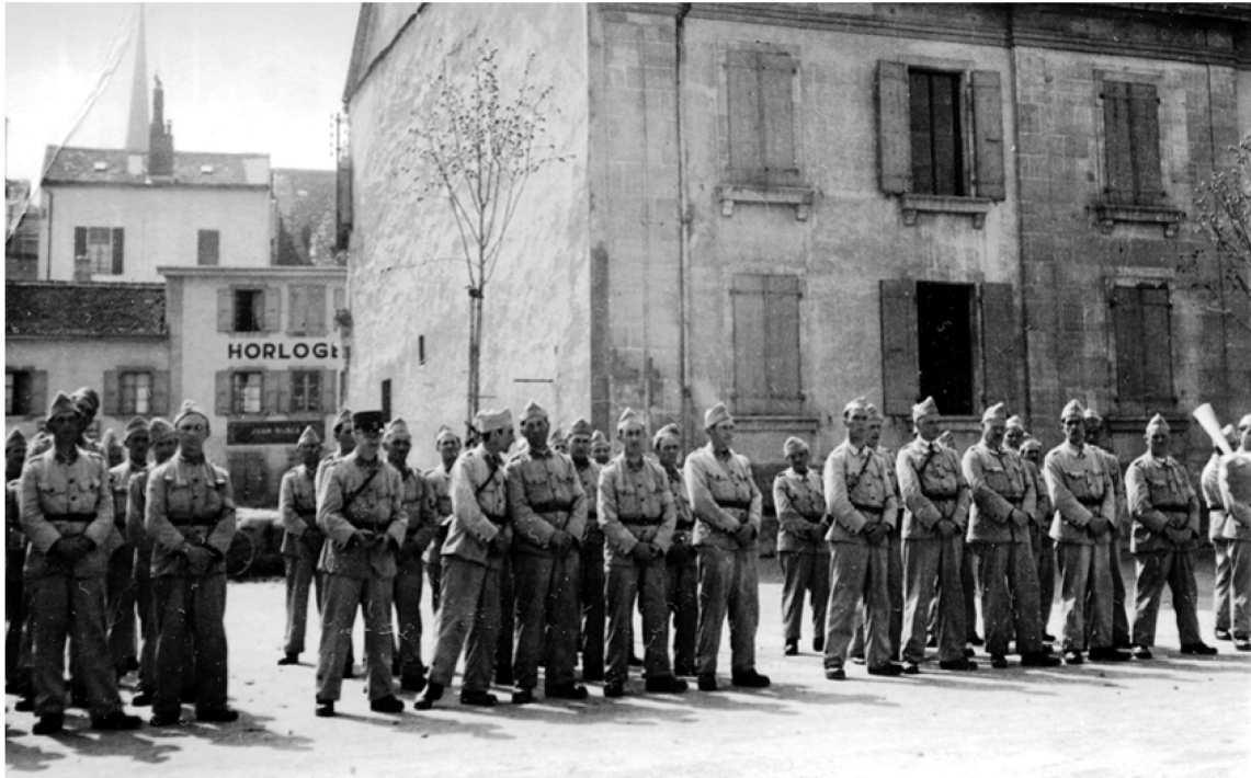
Fig. 2. Une partie de la troupe payernoise sur la place de la Foire. 1944.