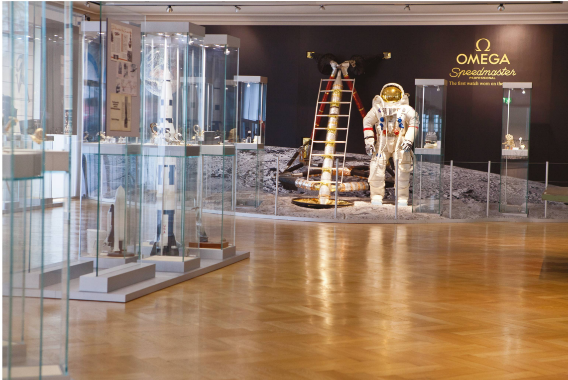
Le Musée Omega à Bienne est le premier musée d'horlogerie ouvert au public.