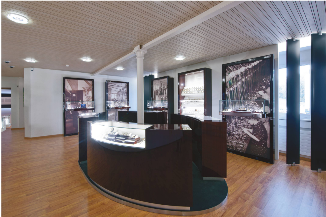
Le Musée Longines à Saint-Imier a été rénové et rouvert en 2012.

donne l'impression au visiteur d'entrer dans le mouvement d'une montre. On distingue un espace d'exposition temporaire (avec les montres les plus récentes) d'un espace d'exposition permanent doté notamment d'un impressionnant mur de verre composé de tous les calibres maison. En 2013, à l'occasion de son 180 e anniversaire, Jaeger-LeCoultre a ouvert dans son bâtiment historique un espace unique dédié à la rencontre et au partage de la connaissance horlogère: «La Maison d'Antoine». Les publics de visiteurs sont très variés, des clients aux fournisseurs en passant par les journalistes et les étudiants; cependant, il faut faire une demande motivée pour obtenir un accord de visite, obligatoirement guidée et combinée ou non avec celle de la manufacture.