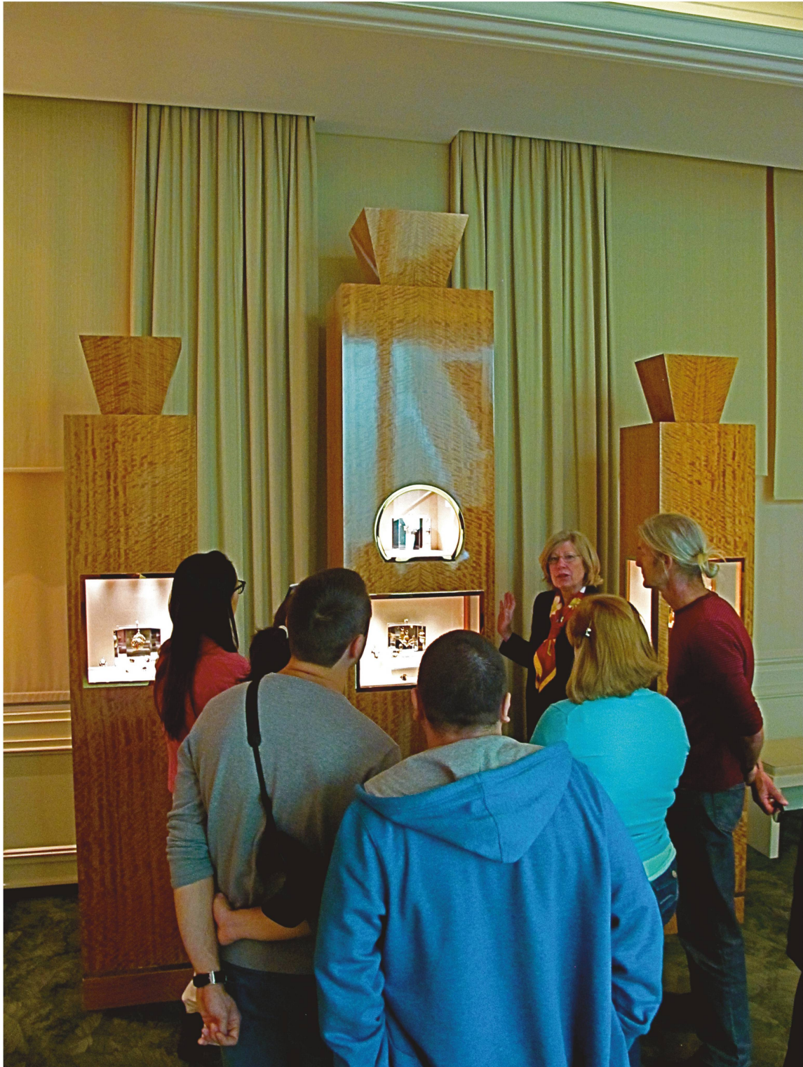
Le Patek Museum à Genève propose une importante collection de quelque 2000 pièces retraçant l'histoire de l'horlogerie.