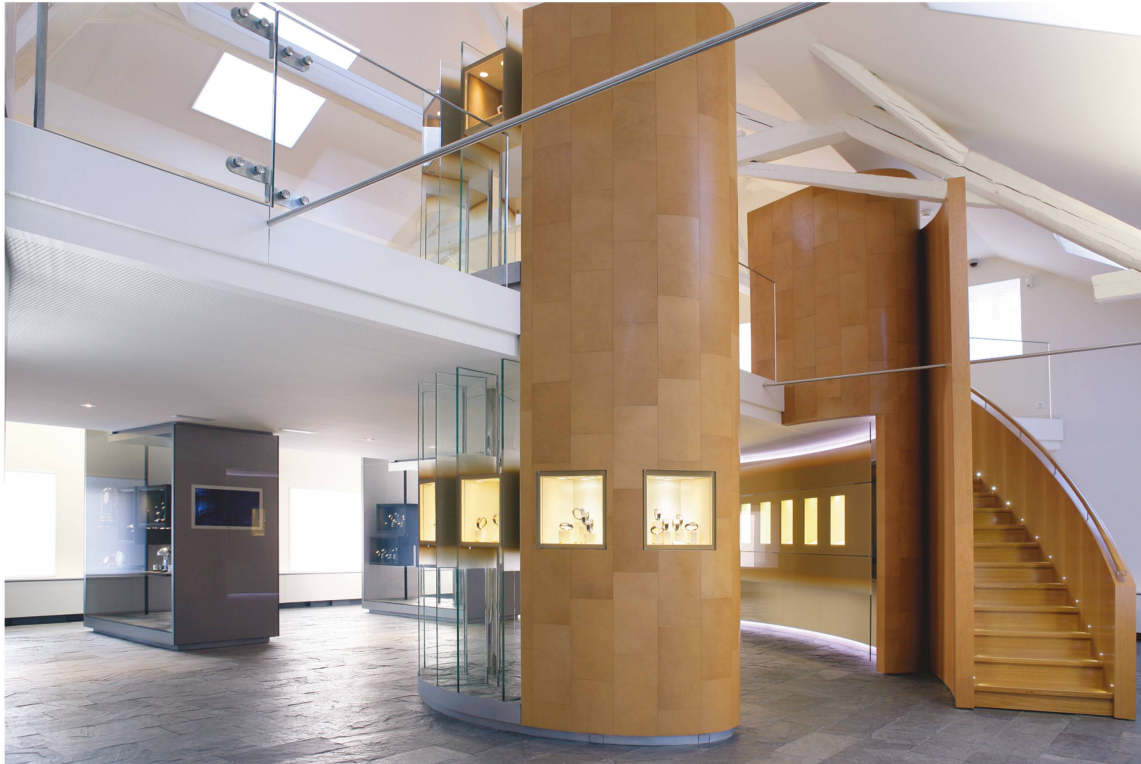
La Galerie du Patrimoine Jaeger-LeCoultre au Sentier se situe dans le bâtiment où le fondateur, Antoine LeCoultre, avait son atelier au début du XIX e siècle.

Plusieurs cas de figure peuvent être rencontrés pour les concepteurs de musées d'entreprises 14 . Si, en premier lieu, aucune contradiction n'est perçue entre l'activité de la firme et son musée, l'exposition est mise en place en se posant uniquement des questions d'ordre muséographique. En deuxième lieu, l'entreprise peut « tuer le musée », ce qui est le cas fréquent d'une collection détournée à des fins publicitaires lorsque les considérations purement commerciales prédominent celles de conservation du patrimoine, par exemple pour les entreprises horlogères qui mettent sur pied des expositions itinérantes lors de manifestations sportives qu'elles sponsorisent, ou des maroquiniers consacrant un étage de leur surface de vente à présenter d'anciennes collections. En troisième lieu, le musée peut « tuer l'entreprise », cas extrême, comme celui de collection automobile des frères Schlumpf, dont la passion leur a fait mettre plus d'efforts et de ressources dans leur musée que dans leur entreprise, tombée ensuite en faillite. En dernier lieu, le musée d'entreprise vit une existence réelle et possède une valeur intrinsèque comme l'Alimentarium de Vevey (Nestlé) ou le Patek Museum, à Genève.