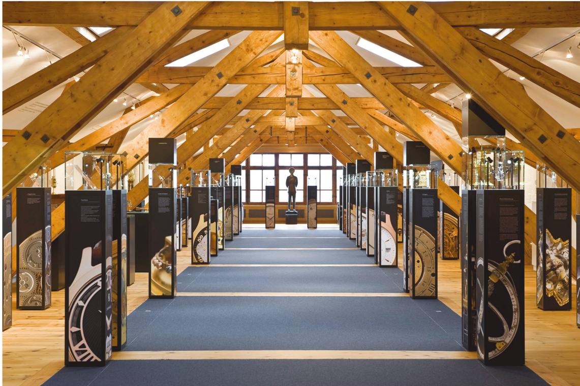
Le L.U.CEUM CHOPARD à Fleurier (jeu de mots avec lyceum et les initiales de Louis-Ulysse Chopard).

Môtiers (NE). Deux principales formes d'accueil et d'expositions au public sont à relever: la visite de site en activité qui prend un caractère de découverte d'activité et la journée portes ouvertes qui revêt un caractère événementiel, présentant la firme dans son secteur d'activité et la rapprochant de son environnement immédiat, par exemple les « Journées particulières » du groupe LVMH, qui ont attiré sur un week-end de juin 2013 quelque 120 000 visiteurs sur quarante-deux sites de production, dont les entreprises horlogères Zenith (Le Locle) et TAG Heuer (La Chaux-de-Fonds) 19 . La visite d'entreprise peut être ponctuelle, périodique, commémorative ou inaugurale.