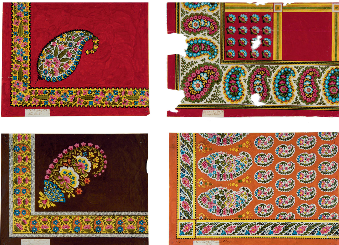
Dessins pour mouchoirs à motifs cachemire sur fonds colorés, gouache, Fabrique-Neuve de Cortaillod, première moitié du XIX e siècle.

meilleure et la moins coûteuse occasion d'expérimenter de nouveaux procédés de teinture, d'éprouver de nouvelles variantes de modèles et de décors. Ces mouchoirs aux couleurs vives pénètrent peu à peu dans les zones campagnardes et montagnardes pour acquérir un caractère cérémonieux dans les costumes des jours de fête ou lors de rituels liés à la vie amoureuse comme les fiançailles ou les mariages 37 . En se transmettant d'une génération à l'autre, ils s'assimilent aux vêtements traditionnels et folkloriques de plusieurs régions suisses 38 .