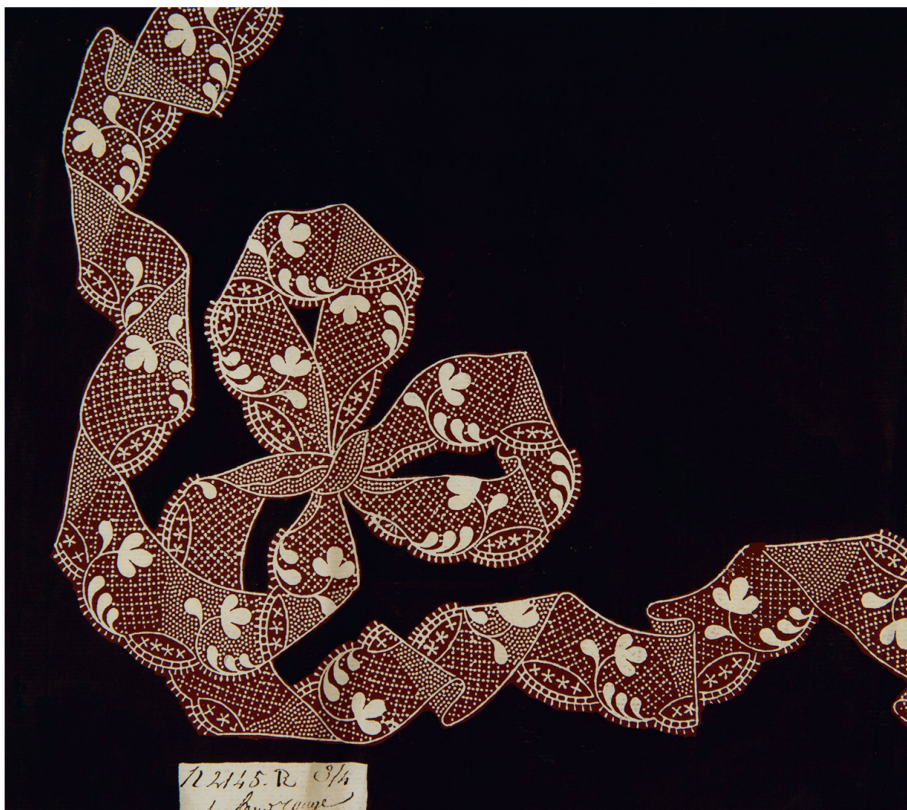
Dessin pour mouchoir à fond brun avec décor en dentelle, gouache, Fabrique-Neuve de Cortaillod, entre 1780 et 1800.