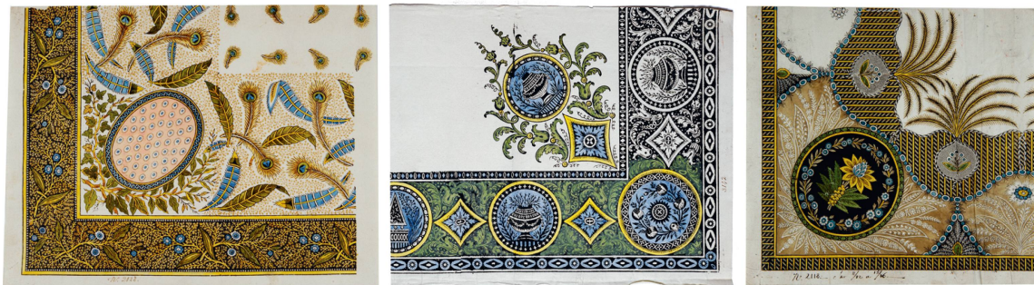
Dessins pour mouchoirs à fleurs, vases antiques, plumes de paon sur fonds de dense feuillage stylisé et petits motifs à répétition, gouache, Fabrique-Neuve de Cortaillod, début du XIX e siècle.

Outre les motifs proprement inspirés de l'Orient, de nombreux tissus se décoient de la flore occidentale qui se décline selon l'esthétique et le style de la deuxième moitié du XVIII e siècle. Les fleurs, pendant la période néoclassique, se dessinent sous la forme de ramages ou de semis. Elles sont disposées en rayures verticales, reliées en petits bouquets sur des fonds blancs, colorés ou piquetés. De plus en plus, ces motifs se détachent sur des fonds colorés unis ou décorés. On retrouve ainsi des roses, des lilas, des bleuets, des pavots ou encore des « plantes nourricières » qui nous rappellent le retour au « naturel », anticipé dès 1770 par Marie-Antoinette à Versailles. Vers la fin du XVIII e siècle, soucieuses de répondre aux demandes de la clientèle, les manufactures de textiles enrichissent leurs productions florales en introduisant des motifs issus du vocabulaire occidental comme, par exemple, des dentelles, des sujets avec vases antiques, des motifs organisés en couronne, des losanges, des quadrillages, des plumes de paon, des rayures et picots dans des tons de bistre, ocre, manganèse. Ces tendances esthétiques reflètent le goût néoclassique, le retour au naturel ou encore l'engouement pour l'Antiquité gréco-latine, typiques de cette période. Ce style se propagera jusqu'à l'époque napoléonienne.