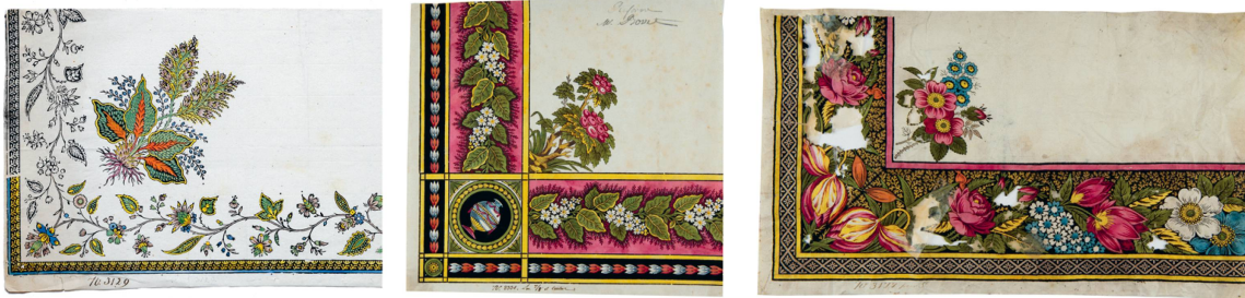
Dessins pour mouchoirs à bordures de fleur naturelles, gouache, Fabrique-Neuve de Cortaillod, entre 1780 et 1800.