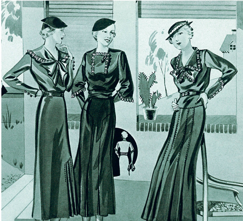
Robes d'après-midi, « chic », Catalogue Automne-hiver 1934-35, p. 18 (détail).

Au cours de la décennie, la coupe des robes devient de plus en plus élaborée: empiècements aux hanches destinés à mettre en valeur les contours, plis sur les jupes, évitement en cloche, godets. L'ornementation des corsages par des nœuds, jabots, volants, jeux de fronces ou de plissés, plastrons, etc. contribue à briser la sobriété de la ligne générale et à étoffer le buste. Une grande variété de cols est proposée, mais les décolletés restent très sages. Vers le milieu des années 1930, une tendance à l'amplification des épaules au moyen de volants, de fronces et d'épaulettes se fait jour. Des « robes d'après-midi », plus longues, apportent une touche de luxe aux catalogues. Nous sommes bien loin du style dépouillé des années 1920! Le degré de complexité de certaines robes laisse à penser que l'industrie de confection avait réalisé de grands progrès en matière de fabrication.