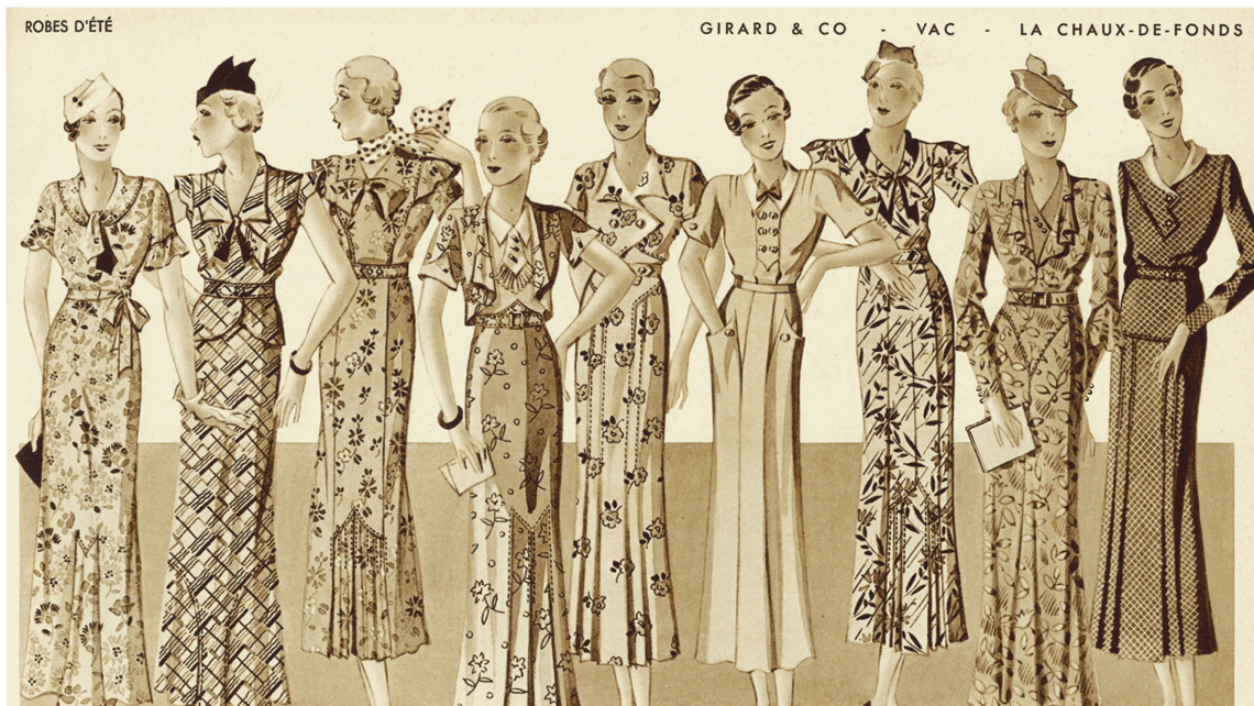
Robes d'été. Le modèle du milieu est « pour jeune personne », Catalogue Printemps-été 1934, p. 9.

La mode s'achemine vers une remise en valeur des formes et des volumes, se fait plus sculpturale et moins fonctionnelle, moins conquérante aussi. Les robes sont plus ajustées au corps, en particulier au buste. La taille remonte progressivement à son emplacement naturel, tandis que les jupes s'allongent à hauteur du mollet et s'évasent légèrement vers le bas. La technique de la coupe en biais sera beaucoup utilisée à cette époque, car elle permet de donner au vêtement un tombé plus fluide, sans pour autant utiliser le volume. « Le biais va mouler le buste (le tissu est travaillé dans sa diagonale, ce qui lui confère souplesse et extensibilité). » 33