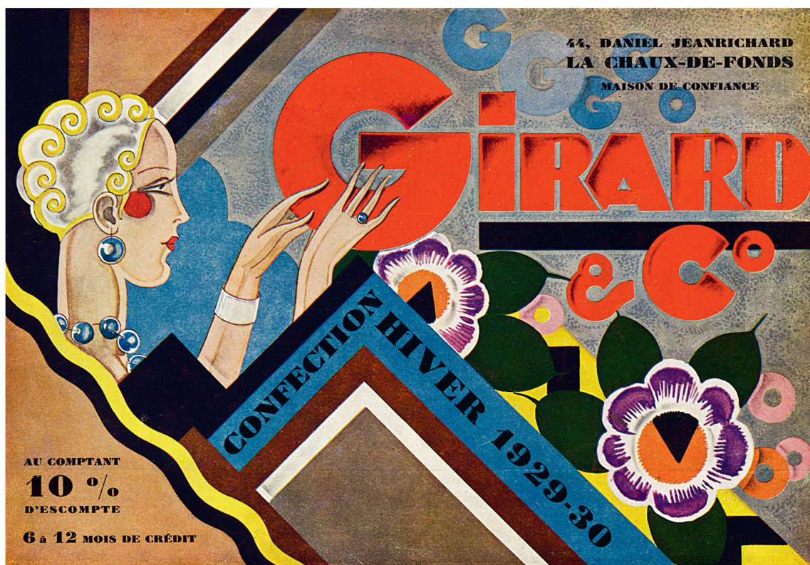
Couverture, Catalogue Hiver 1929-1930.