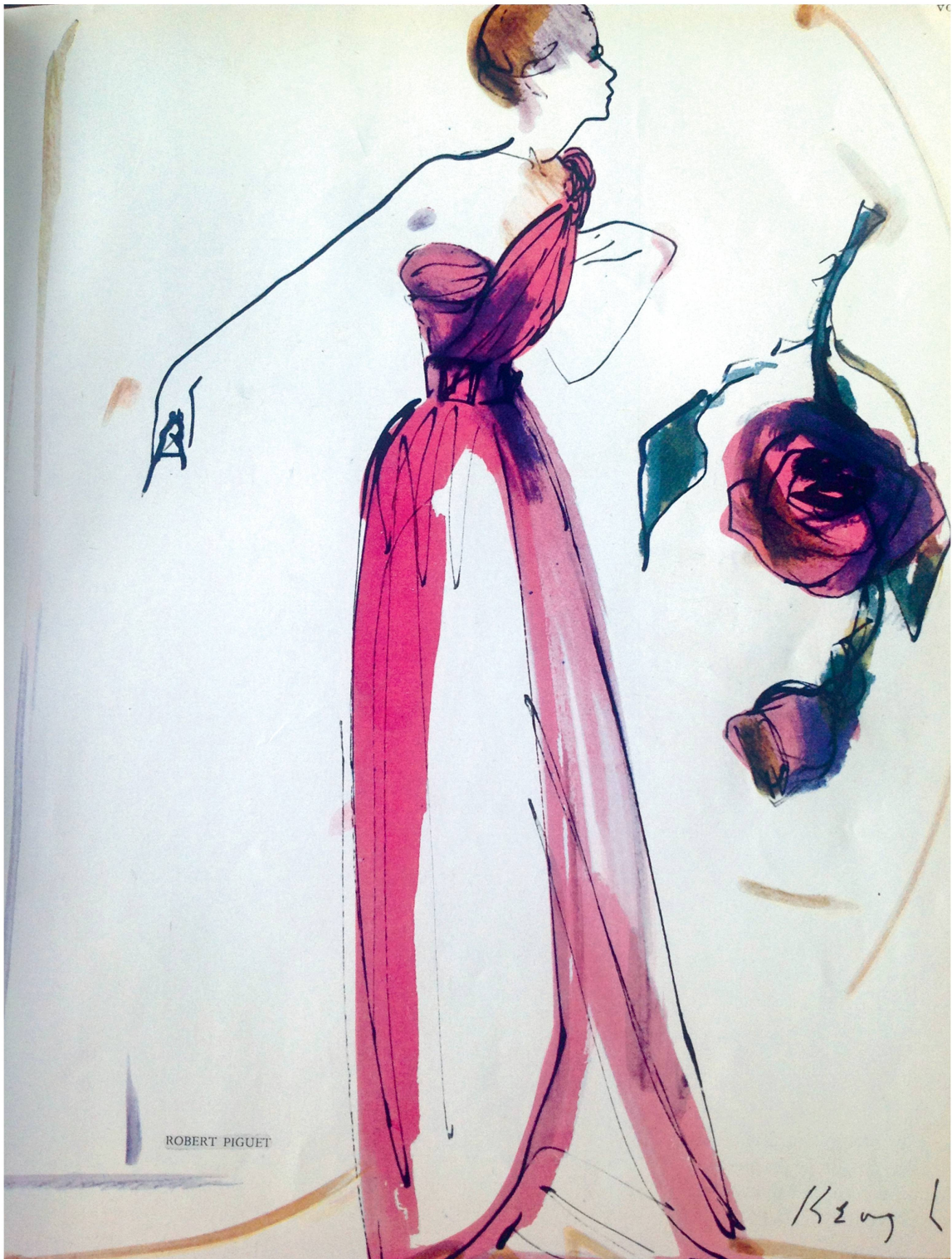
Avant que la photographie de mode ne prenne le relai, le dessin de mode règne en maître. Ici, l'Américain Tom Keogh croque une robe Piguet, taille serrée, buste moulé en souplesse, vers 1949.