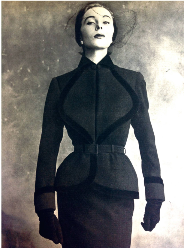
Pour Piguet, l'élégance est à chercher dans la simplicité. Tout est affaire de coupe et naturellement de tissus. Ici, un modèle de 1940.

jeune femme de la haute bourgeoisie parisienne qui lui servit également de modèle et qui conserva l'appartement de la très chic avenue Théophile Gautier, dans le XVI e arrondissement, Piguet s'installa au bord de la Seine, à deux pas de l'Institut de France. Après quoi, en 1938, il élut domicile au N° 60 de l'avenue Montaigne, autre adresse prestigieuse; un appartement qui communiquait directement avec les salons du Rond-Point.