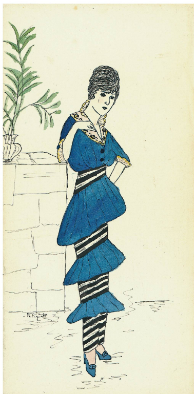
Robert Piguet est encore adolescent lorsqu'il dessine ce modèle bien dans l'air du temps.