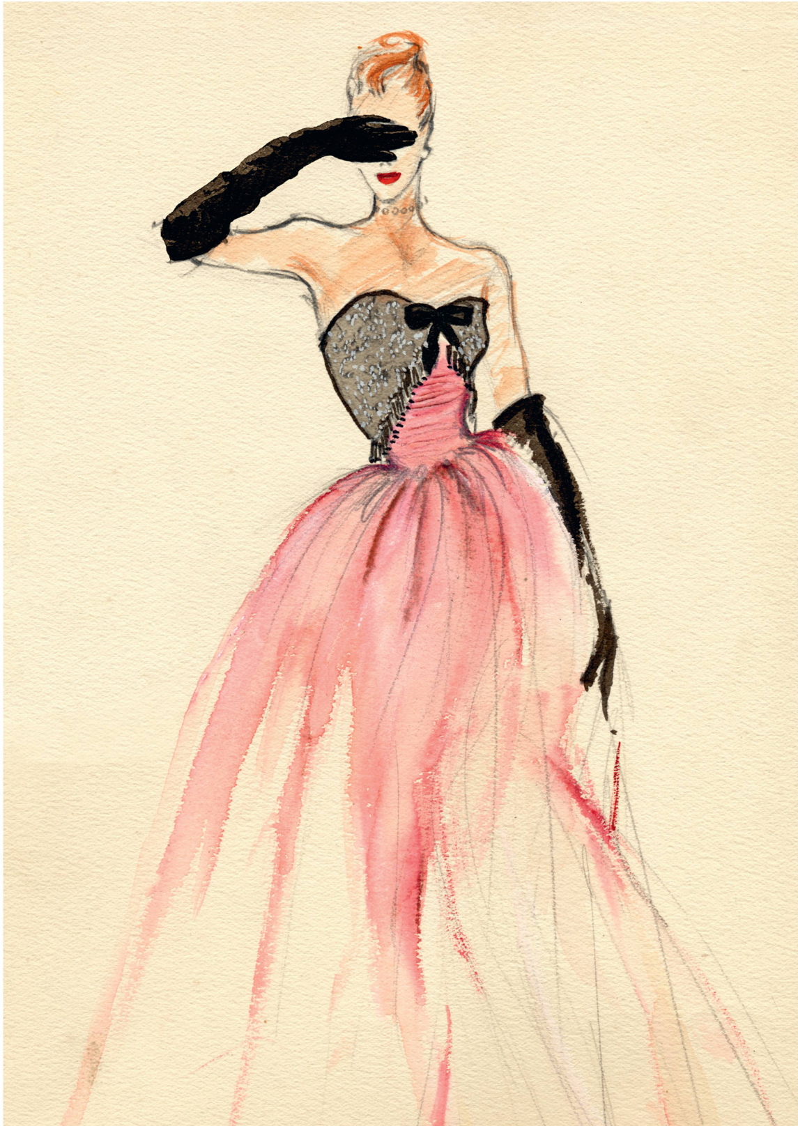
L'élégance de la maison Robert Piguet dans cette création de Hubert de Givenchy, vers 1947.