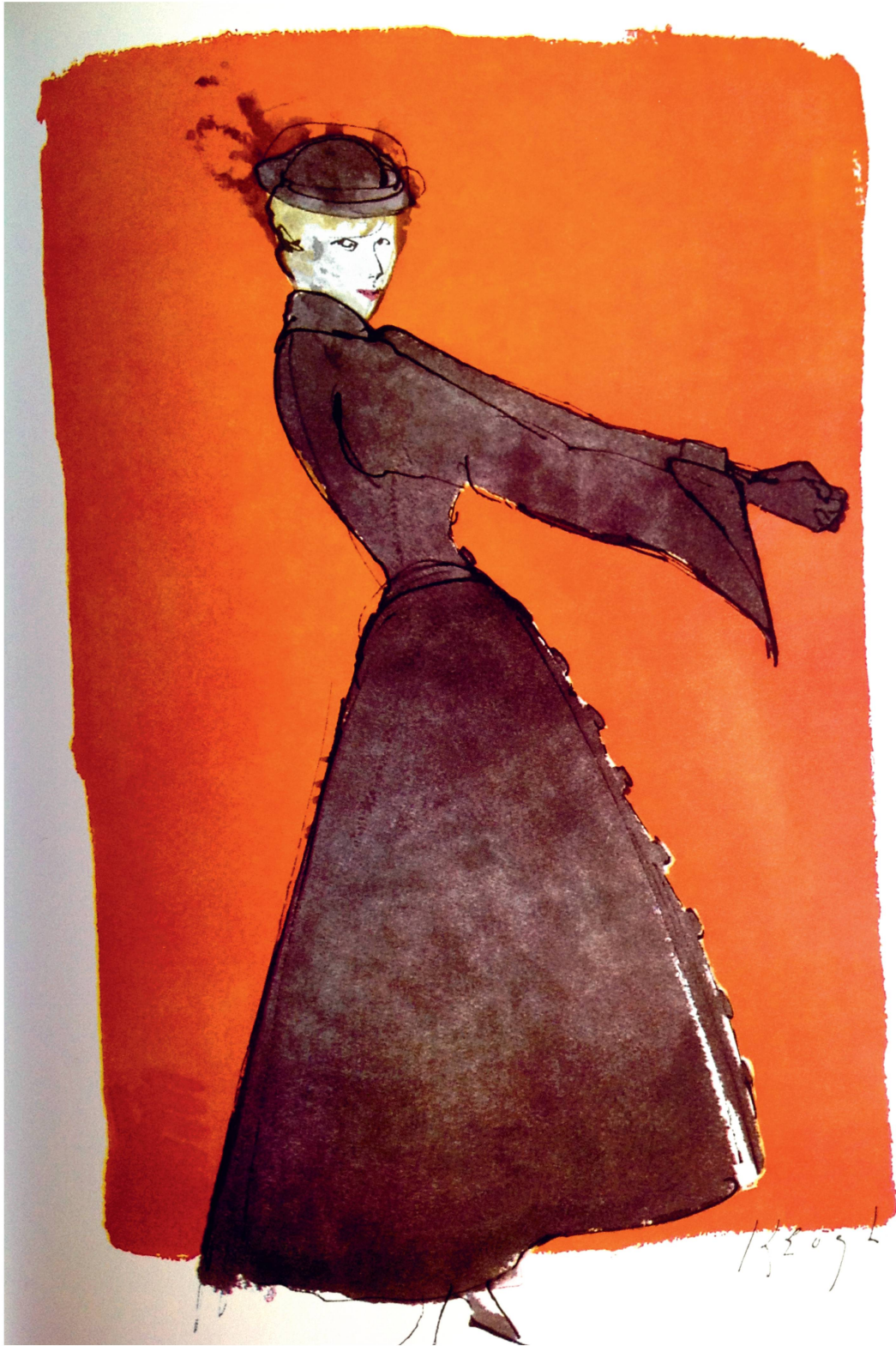
Un manteau de Piguet réinterprété par le dessinateur américain Tom Keogh, 1948.