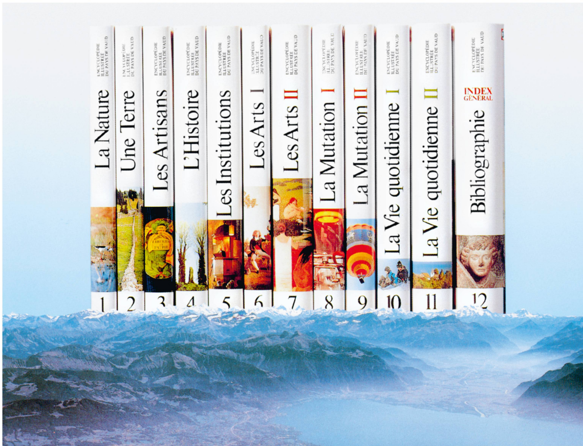
Visuel publicitaire pour le prospectus de vente de la collection complète de l'Encyclopédie illustrée du Pays de Vaud , 1987.

Maillefer de 1903, qui avait marqué le centenaire du Canton, ouvrage épuisé depuis belle lurette, le public manquait d'un instrument de référence ou d'initiation élémentaire. Je ne comprenais pas qu'autorités et milieux intellectuels fussent demeurés si longtemps sans agir. Même mollesse, à l'échelle de la Suisse, depuis le début du siècle, face à l'inexistence de toute présentation de ses quatre littératures.