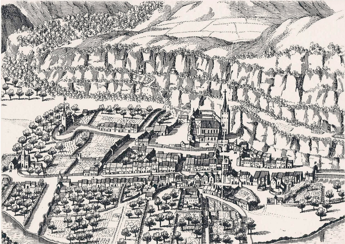
Matthäus Merian, L'abbaye de Saint-Maurice d'Agaune, détail de la Topographia Helvetiae, Rhaetiae et Valesiae , 1642, gravure sur cuivre, 400 x 294 cm.

route qui conduit de France et du nord de l'Europe en Italie, avec un poste de péage attesté depuis l'Antiquité.