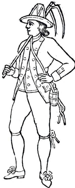
Membre de la Confrérie des Vignerons avec les attributs du vigneron, livret officiel de la Fête des Vignerons de 1797.

des décès de 1728 à 1787 19 , ainsi que des registres de paroisse de Corsier 20 . Cette base de données permet d'avoir une bonne vision des liens de famille entre vigneron et de corriger certaines erreurs dans la dénomination des personnes. En outre, un logiciel d'analyse de la parenté 21 est utilisé pour déceler les liens de famille entre époux.