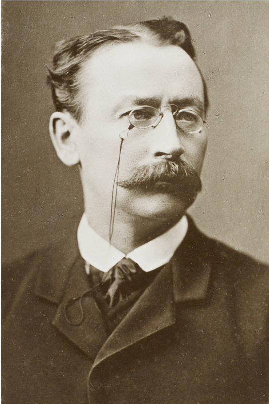
Paul Cérésolle (1832-1905), bourgeois de Vevey, homme de loi et politicien, ancien conseiller fédéral et Abbé de la Confrérie lors de la Fête des Vignerons de 1889.

L'année suivante, partisan d'une révision centralisatrice de la Constitution fédérale, il s'oppose à ses compatriotes, profondément fédéralistes. Il doit quitter le gouvernement fédéral en 1875 et se tourne vers les chemins de fer, le grand chantier du XIX e siècle helvétique, riche en prébendes confortables mais aussi en jeux d'influence périlleux sur lesquels maints politiciens trébucheront. Colonel divisionnaire, il retrouvera le Conseil national en 1893, dans le cadre de la grande réconciliation qui rassemble les radicaux, empêtrés dans un scandale ferroviaire, et les libéraux, mais tous inquiets de la montée du socialisme.