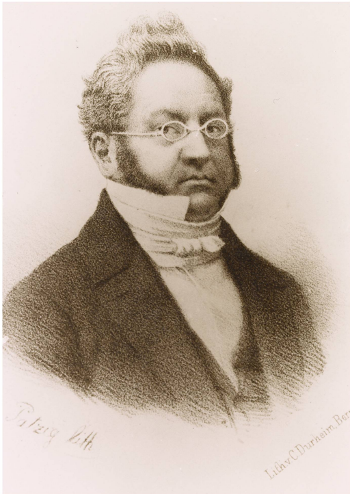
Henri Druey (1799-1855), homme politique, avocat et journaliste.