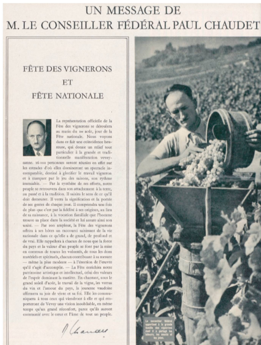
Paul Chaudet (1904-1977), vigneron de Rivaz, originaire de Corsier-sur-Vevey, politicien de droite, conseiller fédéral de 1954 à 1966, in L'Illustré , 1 er août 1955.