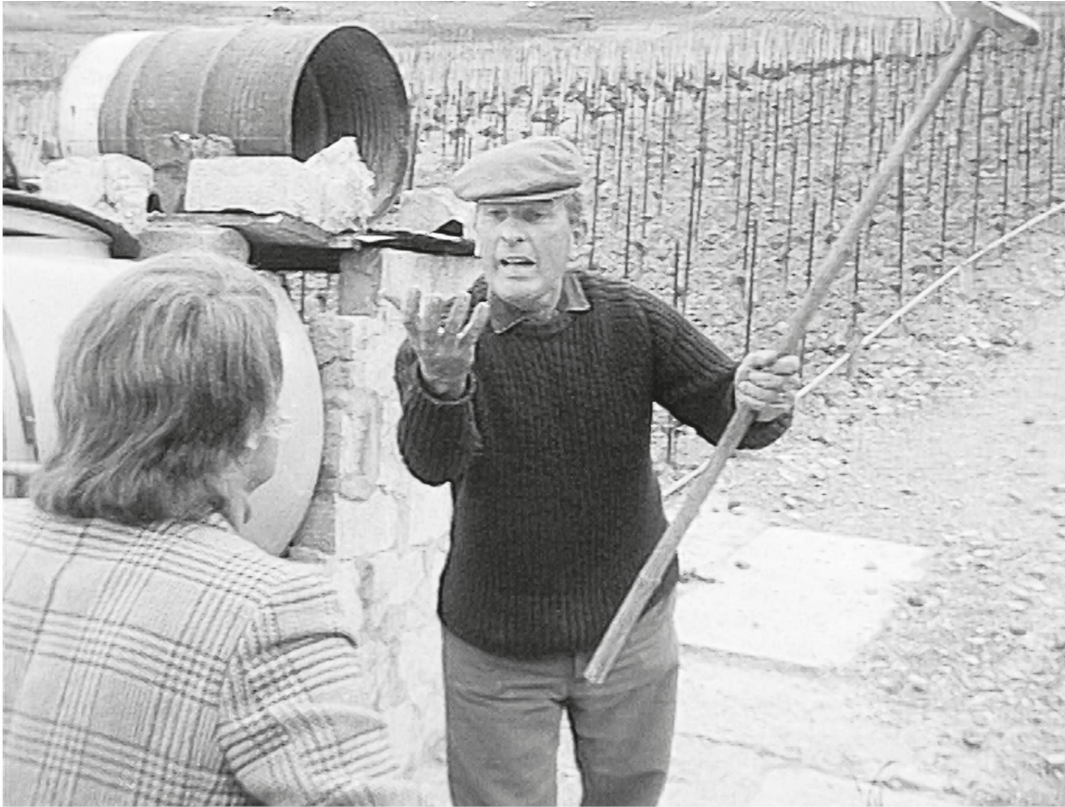
La confrontation ( Temps présent , « Qu'est-ce qui fait courir Franz Weber », 1 er juin 1972).

habitants de la région. Évoquant l'initiative Franz Weber, le vigneron vaudois lâche de manière très significative : « C'est surtout le vigneron qui a sauvé le Lavaux, qui a su exposer son problème » 43 . À travers la relecture de cet épisode, Étienne Fonjallaz passe sous silence les divisions de l'époque pour construire une forme de mémoire vigneronne héroïque où ce sont les autochtones qui s'attribuent le seul mérite de la conservation de ce bastion patrimonial. Franz Weber, incarnation de l'écologiste citadin, qui plus est ici alémanique, est renvoyé à son caractère « hors sol » qui l'associe, symboliquement, aux riches étrangers auxquels étaient destinés, selon les Pro Weber, les immeubles résidentiels qui devaient être construits au milieu des vignobles. Lavaux n'est pas la seule région vigneronne en prise avec cette problématique ; à la même période, par exemple, les vigneronnes du village valaisan de Plan-Cerisier se liguent contre un projet immobilier 44 . Ces confrontations s'inscrivent dans une période qui