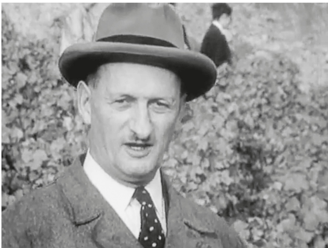
Les vendanges de Chaudet (RTS, 31 décembre 1959).

voit le développement des mouvements écologistes et, avec eux, une nouvelle sensibilité envers la dégradation de l'environnement 45 . Des luttes qui déboucheront sur la loi fédérale sur l'aménagement du territoire (LAT), adoptée le 22 juin 1979 et entrée en vigueur le 1 er janvier 1980. Le cadre réglementaire, qui tente de mieux redéfinir les logiques de construction tout en protégeant le paysage, est fortement contesté par les milieux immobiliers mais aussi par les héritiers d'une tradition fédéraliste qui ne veulent pas des ingérences « externes » sur les régions concernées.