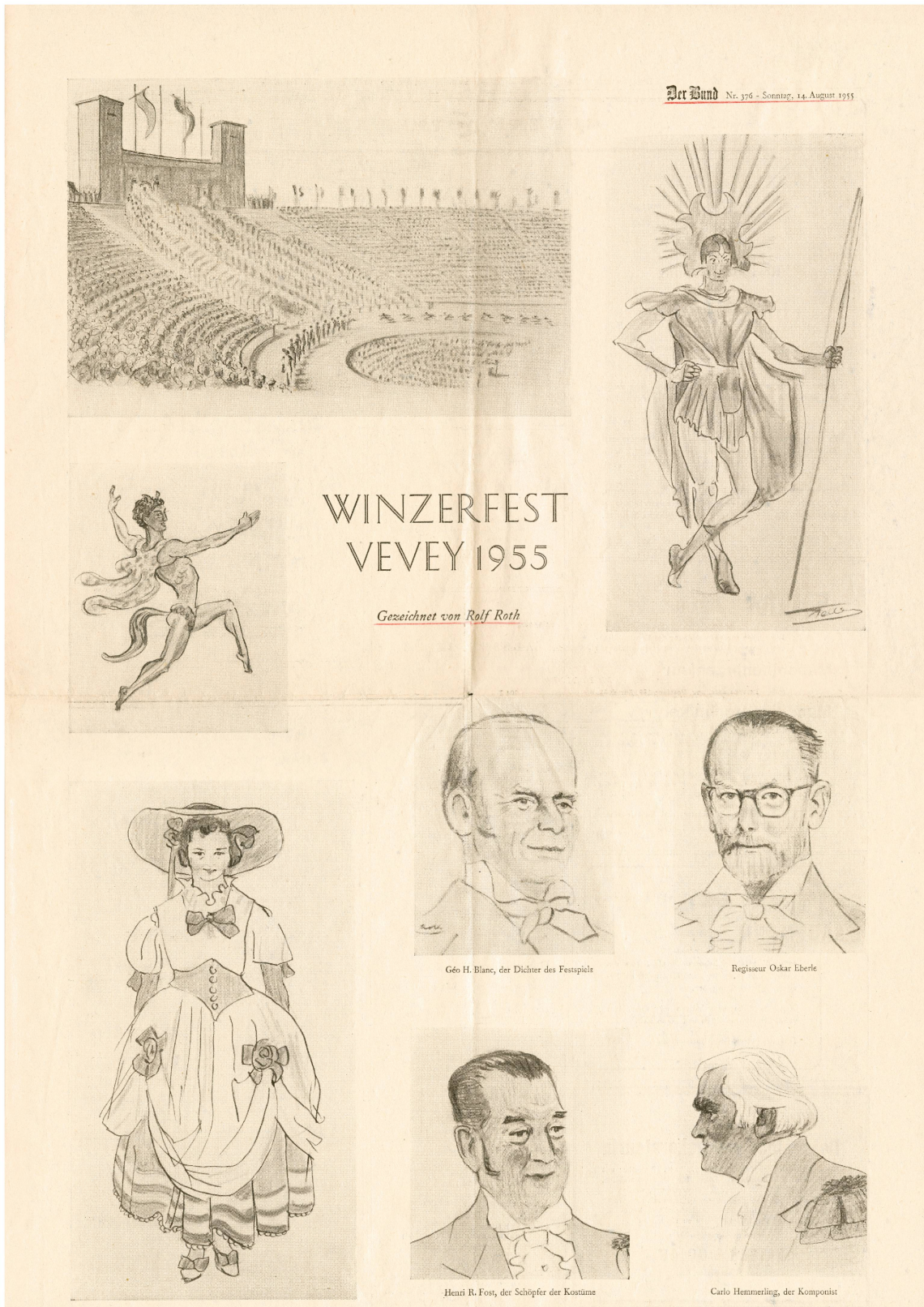
« Winzerfest Vevey 1955. Gezeichnet von Rolf Roth », Der Bund , 14 août 1955 .