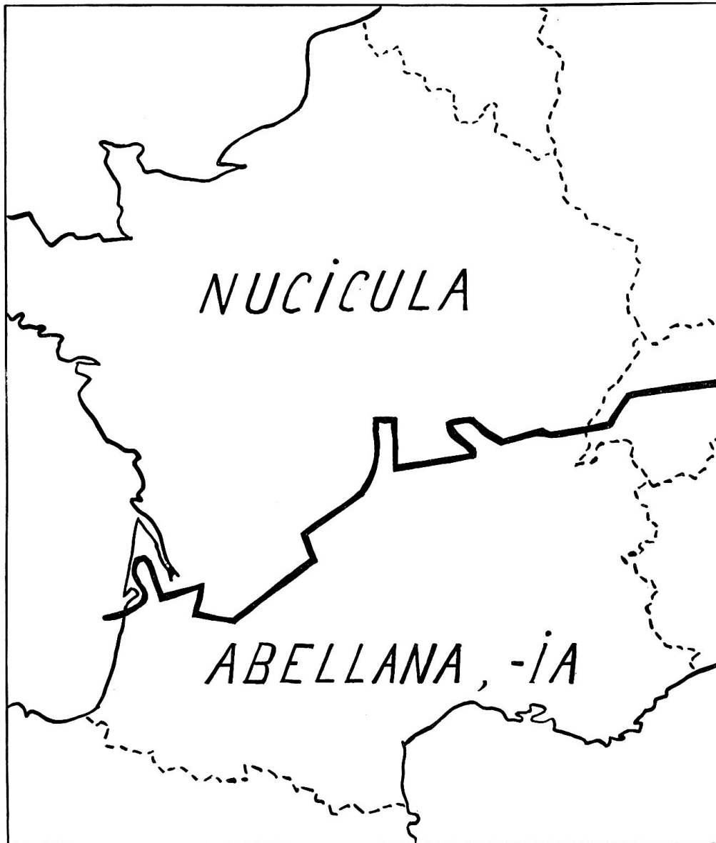
CARTE 1. — Les dénominations gallo-romaines de la noisette, d'après ALF 919.

sation n'a pas été modifiée depuis le moyen âge, ont été apportés chez nous par la romanisation à la place où ils sont encore. Nous avons alors la