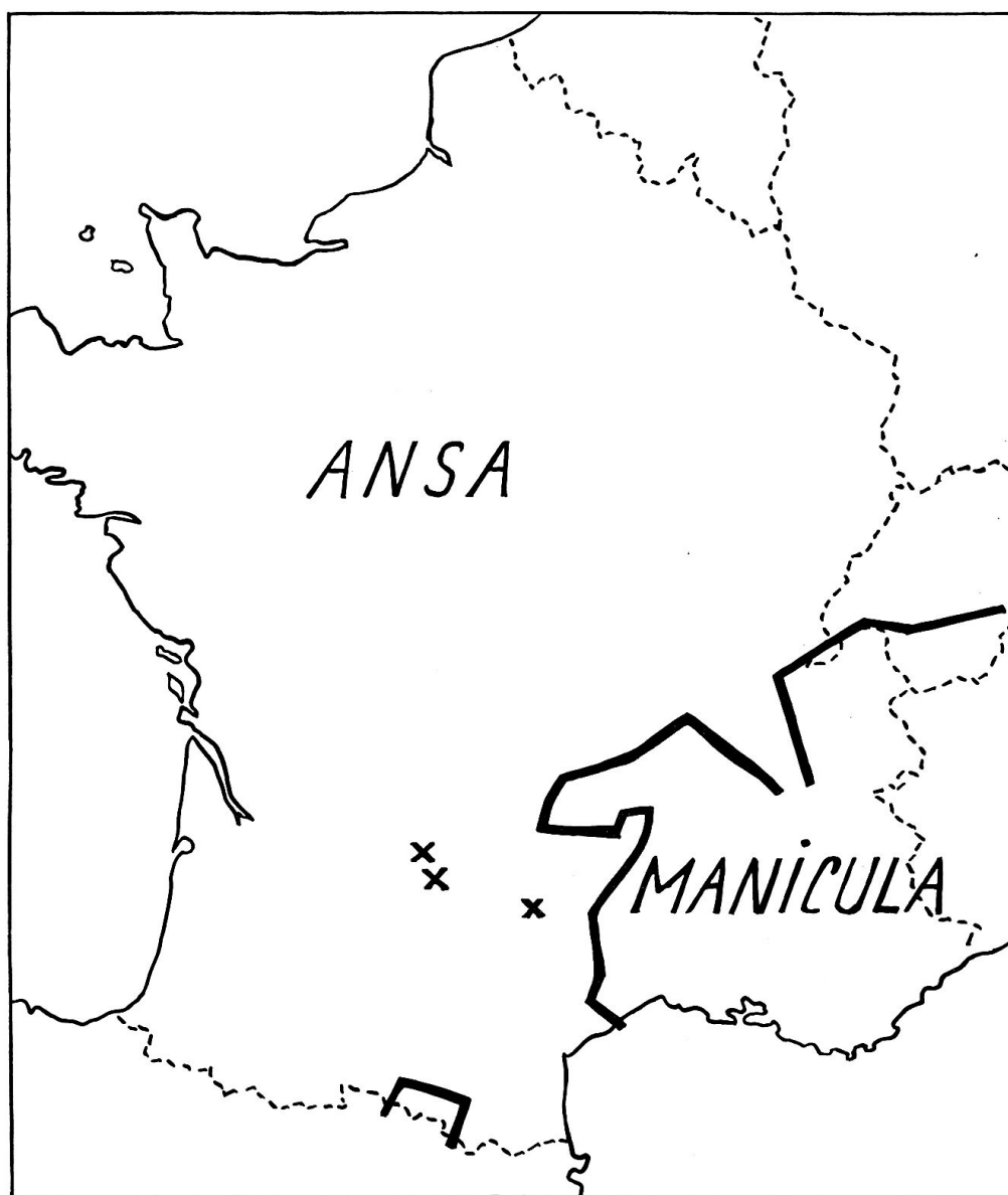
CARTE 3. — Les dénominations gallo-romaines de l'anse, d'après ALF 45 et FEW .