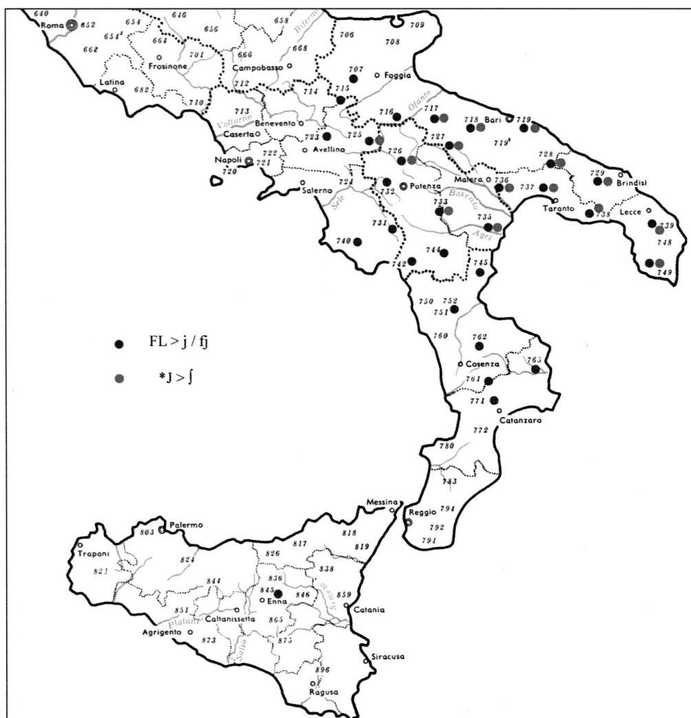
c. 1 (fonti: AIS 429, 740, 1357)

- L'esito di BL iniziale mostra quasi ovunque una variazione [j]/[ʝ] a seconda della posizione debole o forte (6) : [jaŋkə] “bianco”, [ɛ ʝaŋkə] “è bianco”. Tuttavia in un'area che si sovrappone in parte a quella appena menzionata (cfr. carta 2) si ha [ʝ] in tutte le posizioni (7) .