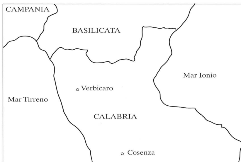
Figura 1. Posizione geografica di Verbicaro

diretto lessicale, infatti (il tipo Gianni ha mangiato la mela ), l'accordo si mantiene (come nei dialetti alto-meridionali più conservativi) solo se il participio presenta flessione interna metafonetica, mentre è agrammaticale se il participio ha flessione esclusivamente affissale (v. il §5.2). Di questa particolarità, che il verbicarese condivide con alcuni altri dialetti parlati entro l'area Lausberg o nelle immediate vicinanze, si offrirà un inquadramento geolinguistico al §7, dopo aver perfezionato al §6 la descrizione delle condizioni verbicaresi con l'analisi delle differenze che il dialetto innovativo oggi presenta rispetto a quello dei più anziani: l'innovazione consiste nel divenire opzionale dell'accordo in tutti i costrutti riflessivi, che invece lo presentano categoricamente nel verbicarese conservativo. Anche questo mutamento in corso, così come la perdita selettiva dell'accordo con l'oggetto diretto lessicale (fronte quest'ultimo sul quale le due varietà verbicaresi non si differenziano), si inquadra entro la generale deriva diacronica romanza che ha visto una progressiva riduzione dell'accordo del participio passato nelle perifrasi verbali perfettive.