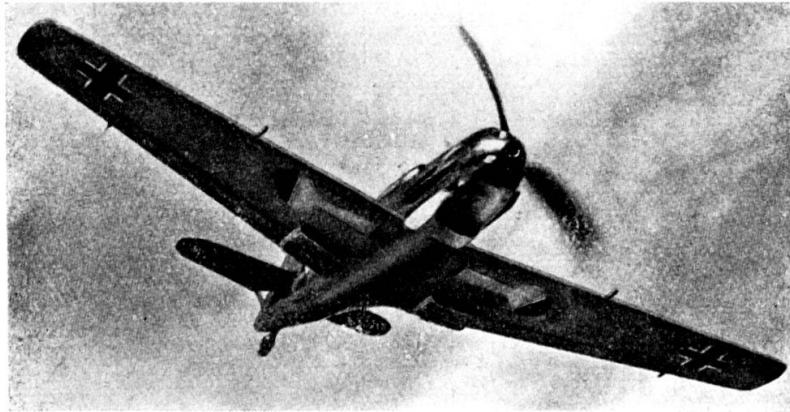
Cacciatore MESSERSCHMITT „Me 109“ dell'aviazione dell'asse