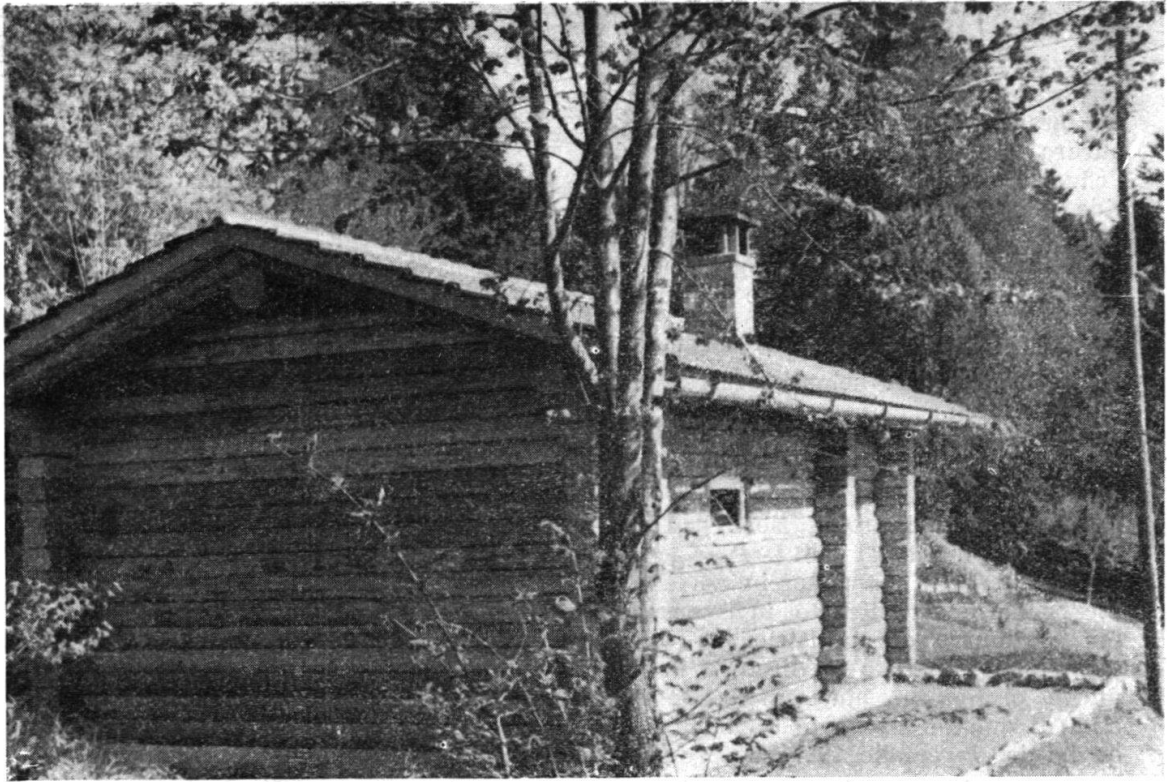
A Macolin le diverse costruzioni sono sparse nei boschi: ecco la «sauna».