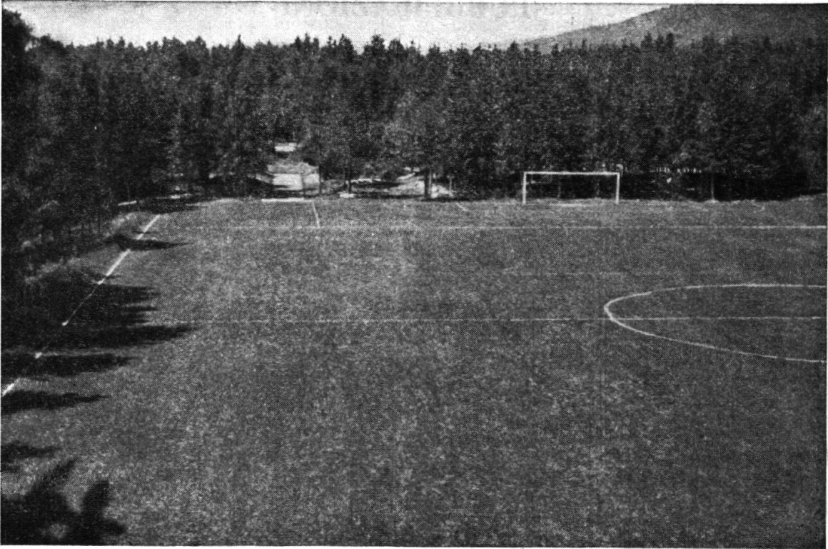
Terreno per il gioco del calcio.