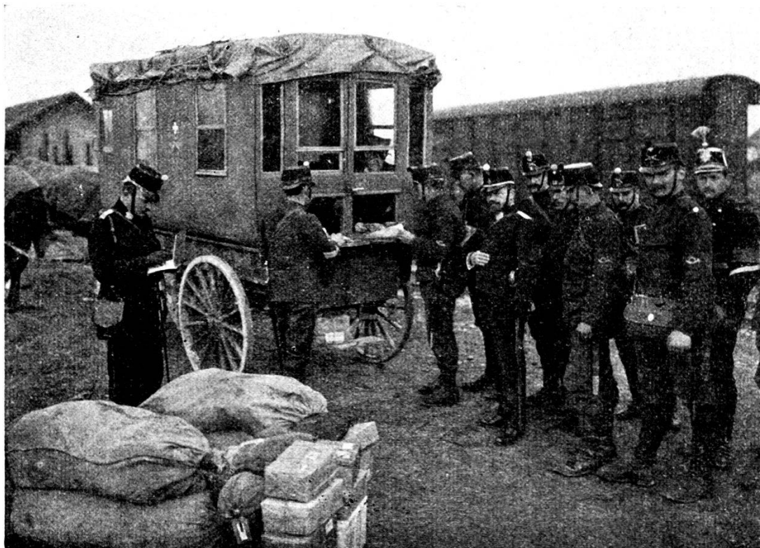
Posto di rifornimento ed ufficio ambulante (1915)

in servizio. Questi uffici erano praticamente ingombri di invii in partenza dalla truppa o a destinazione della stessa. I sacchi della biancheria cagionavano non pochi grattacapi, tanto per il peso come per il volume, tanto che per evitare gli inconvenienti di questo va e vieni, il capo dello Stato Maggiore Generale ordinò, il 10 agosto 1870,