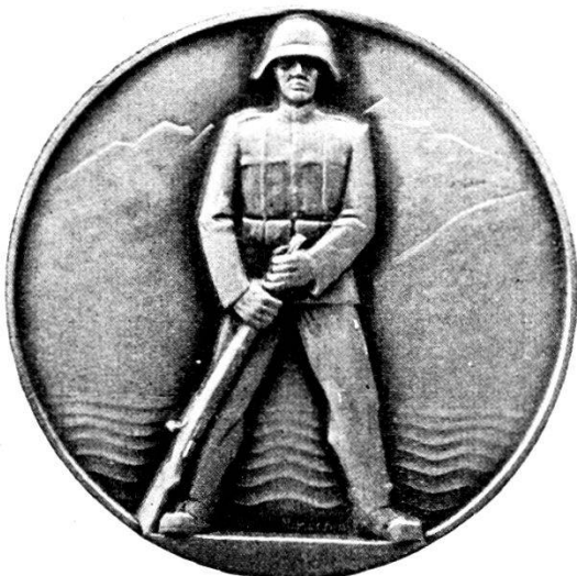
«La difesa» del Ticino