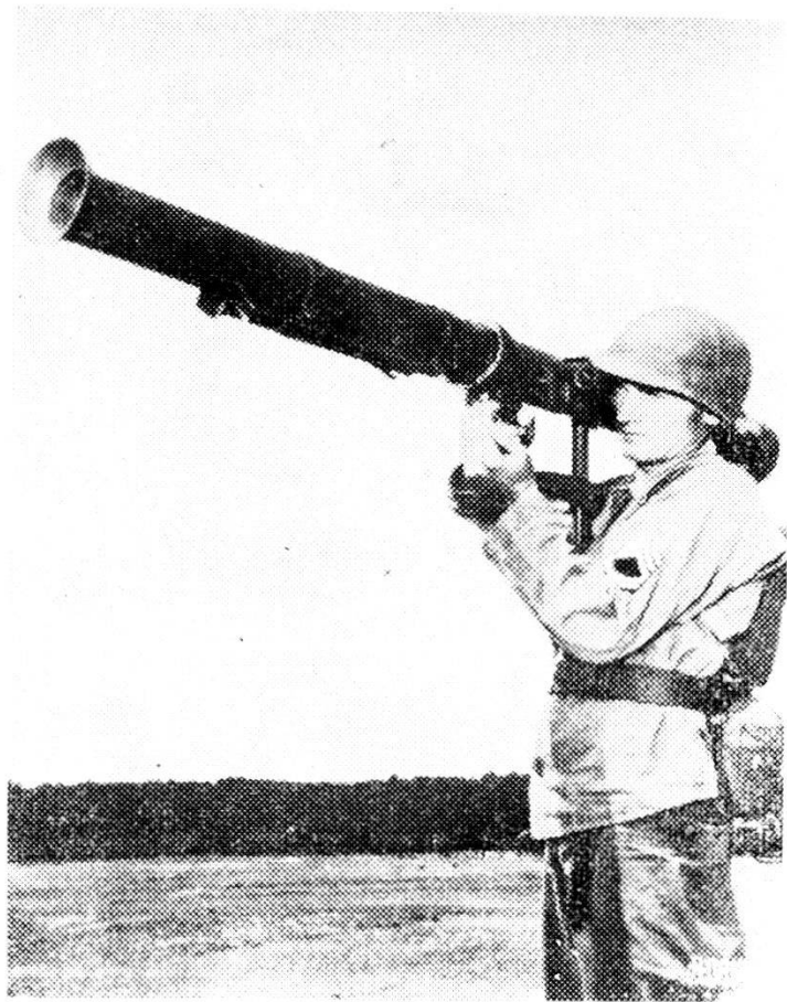
Lancia-razzi anticarri « Bazooka ».