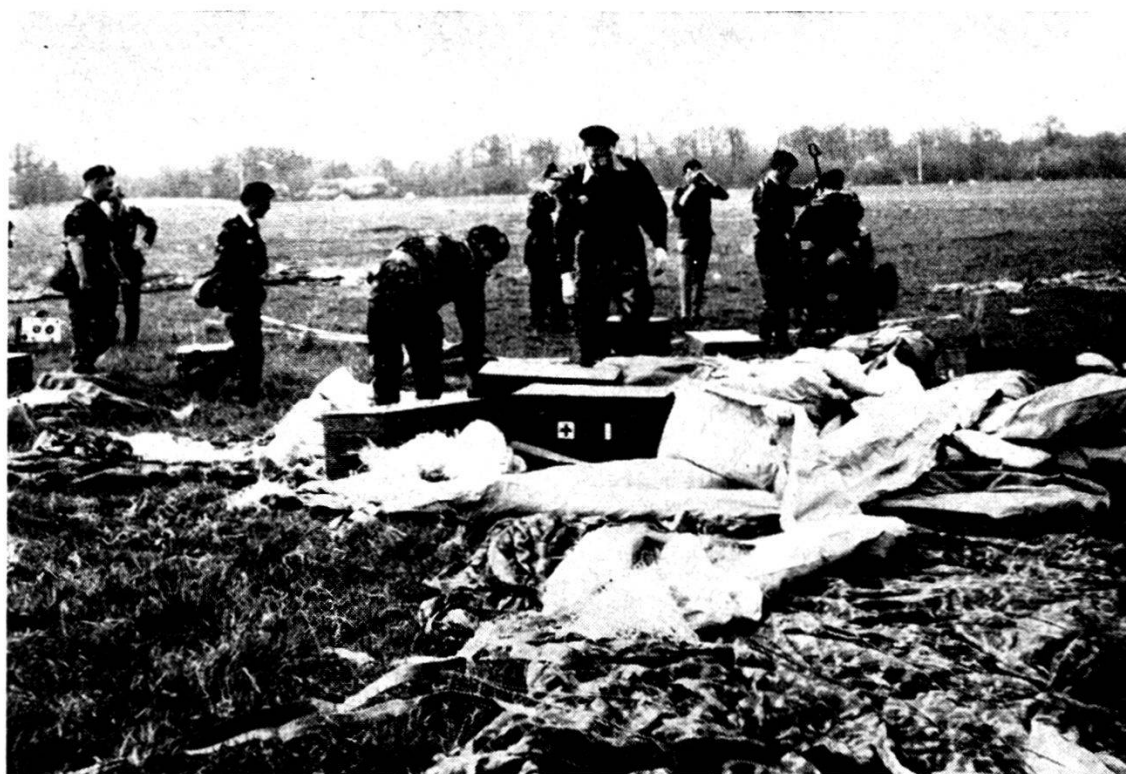
Il materiale paracadutato