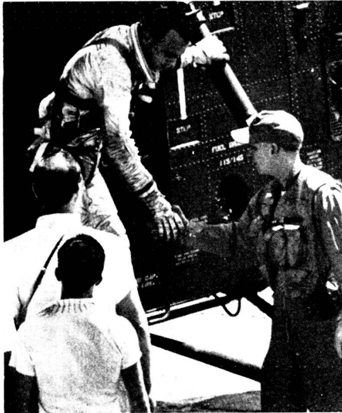
Aln B. Shepard lascia l'elicottero che lo ha raccolto nell'Atlantico pochi minuti prima al termine del volo spaziale suborbitale da Cape Canaveral.