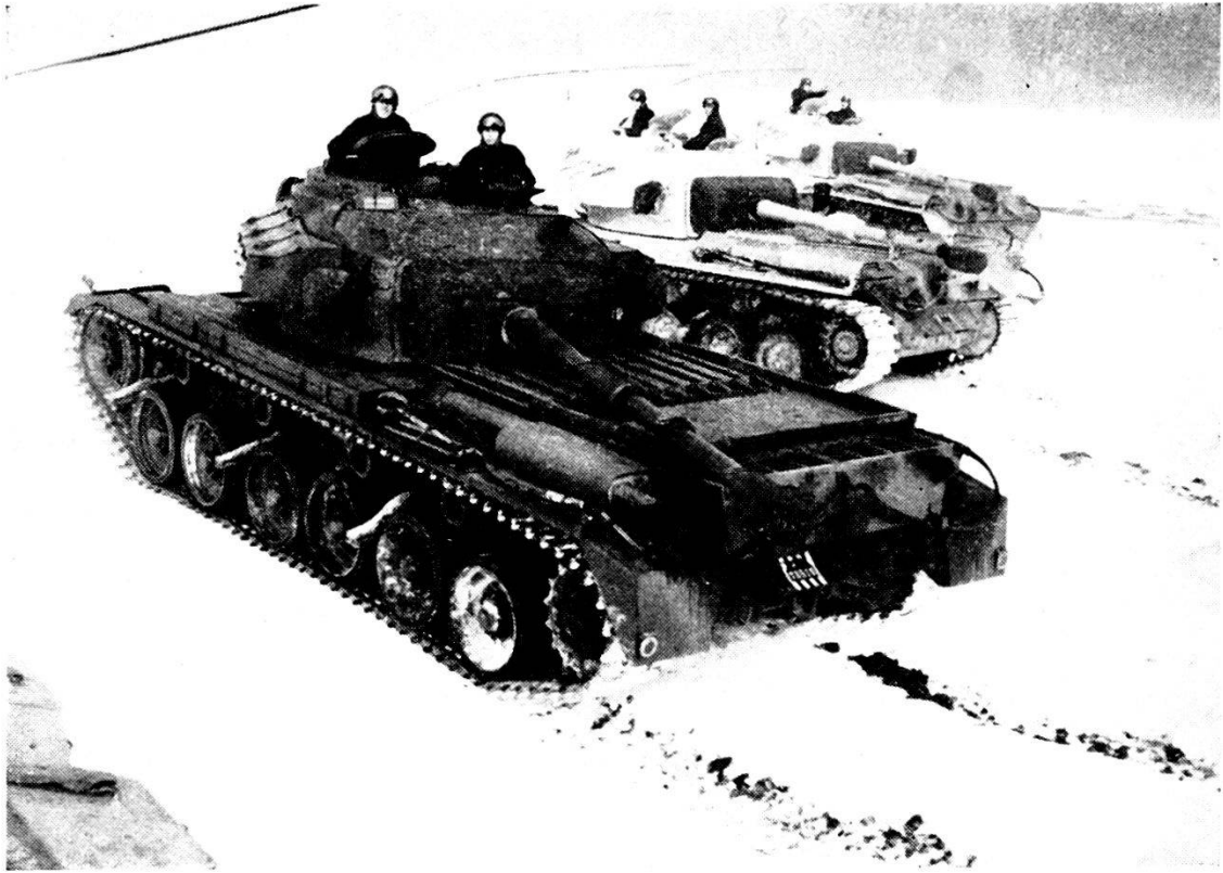
Svizzera: carri armati «Centurion»