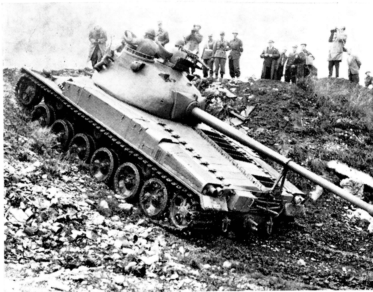
Svizzera: il Pz. 58