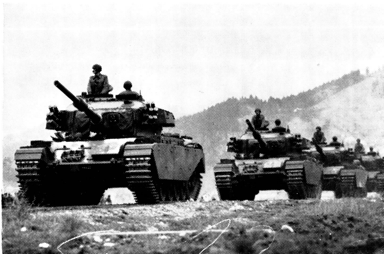
Carri «Centurion» sulla Piazza d'armi di Thun