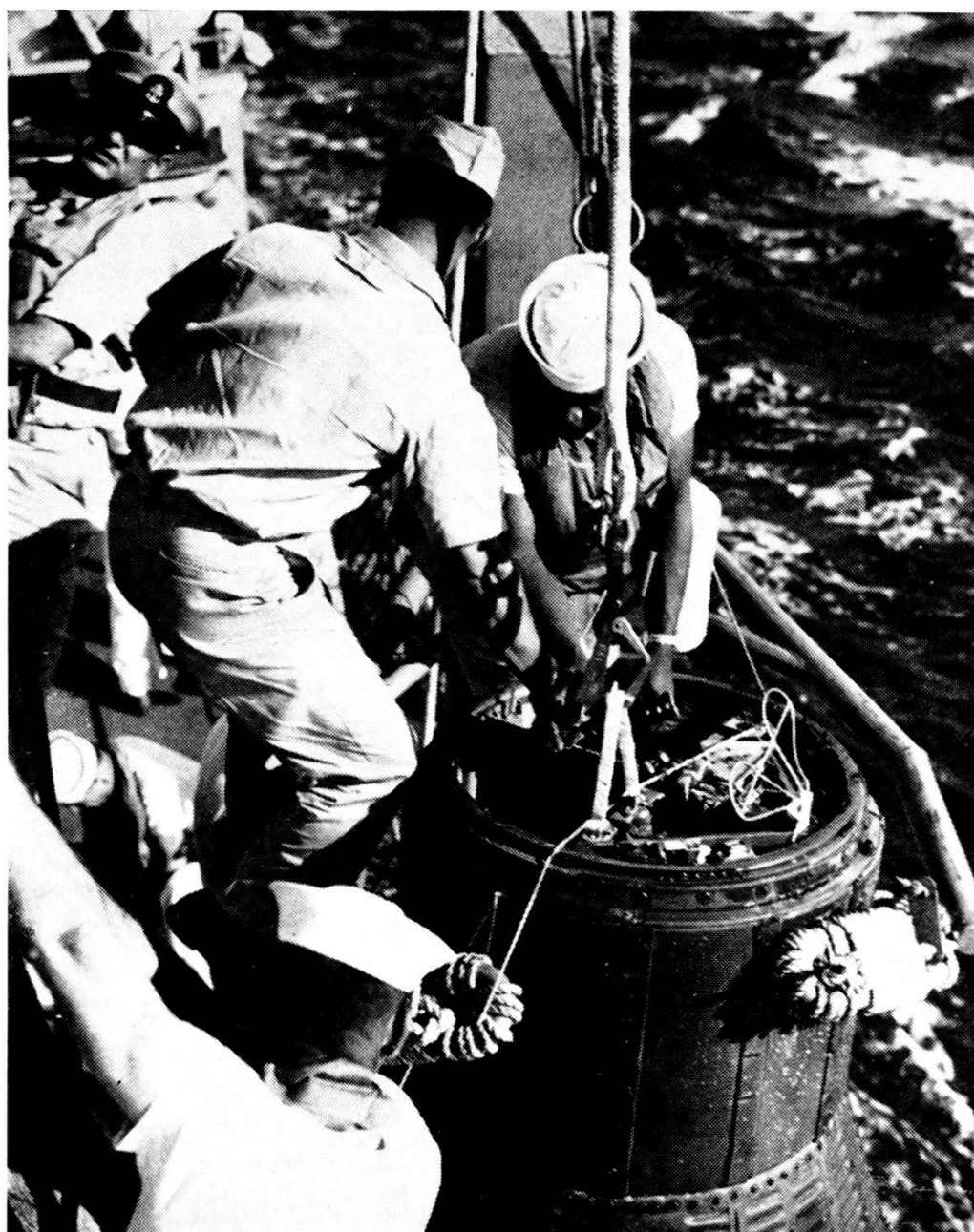
Marinai del cacciatorpediniere Noa occupati al ricupero della capsula Friendship 7 poco dopo l'ammarraggio di quest'ultima.