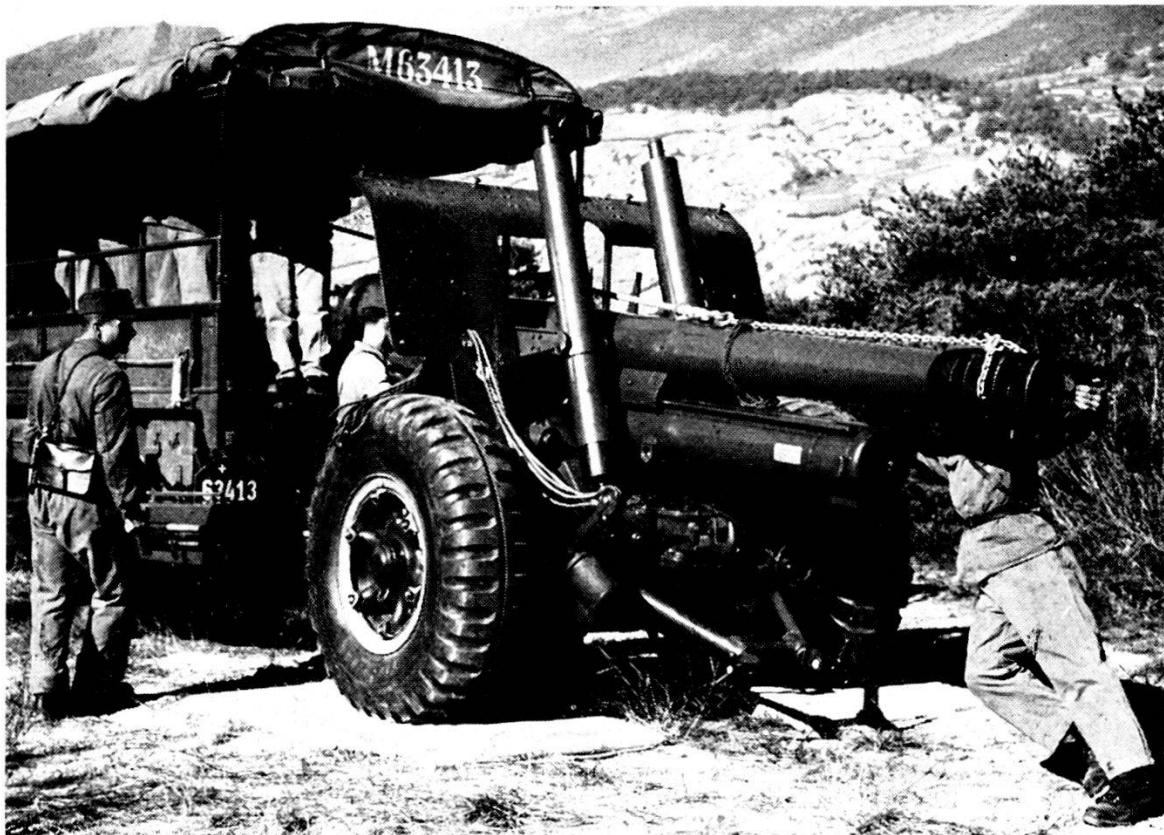
Sostituzione della canna di un obice 15 cm