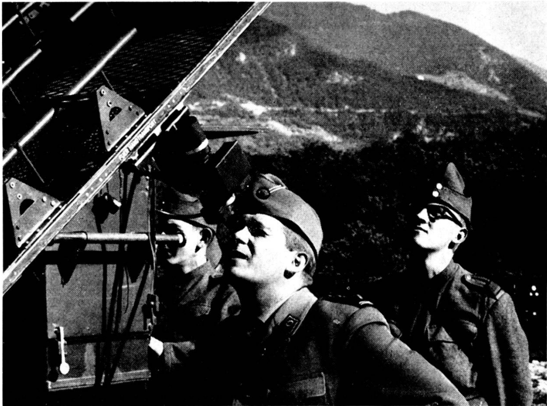
Un ufficiale controlla personalmente l'efficienza di un'antenna radiogoniometrica «Peiler» dell'artiglieria