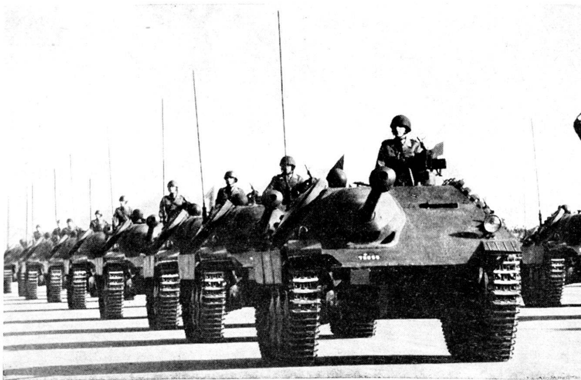
Cacciatori di carri armati G 13

Nell'ultimo fascicolo (copertina e pag. 261) i cacc. c. arm. G 13 sono diventati AMX 13. Nel ripetere quell'illustrazione e l'altra della pag. 262 approfittiamo per aggiungere alcuni dati sui due veicoli, richiamando quanto su di essi è stato detto a pag. 64 e 65 fasc. II 1962.